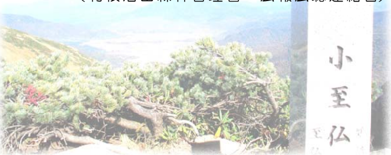
至仏山山頂からみなかみ町方面を望む

至仏山（標高2,228㍎）は、群馬県利根郡片品村とみなかみ町にまたがり、尾瀬国立公園尾瀬ヶ原の南西に位置しています。