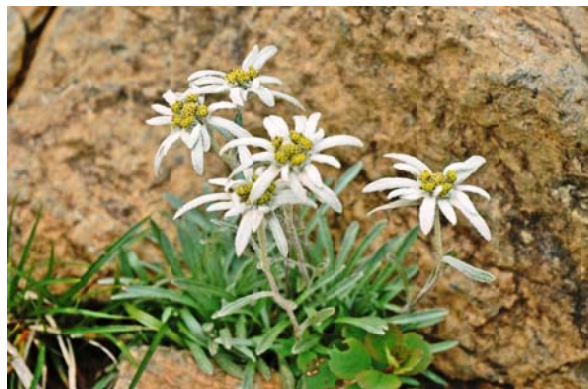
可憐に咲くホソバヒナウスユキソウ

山頂まで登ればみごとな眺望が開け、尾瀬ヶ原の奥にそびえる燧ヶ岳をはじめ会津駒ヶ岳、平ヶ岳、越後駒ヶ岳、中ノ岳、日光白根山など、「日本百名山」に名を連ねる山々が一望できます。