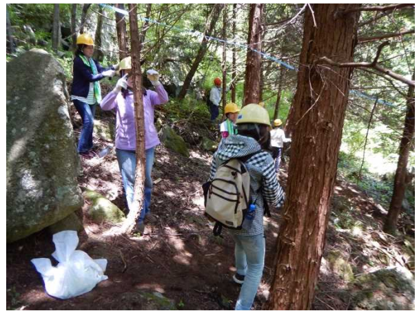
皆さん、夢中で枝を落としています。