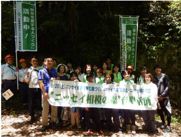
参加者による記念撮影。皆さんお疲れ様でした。