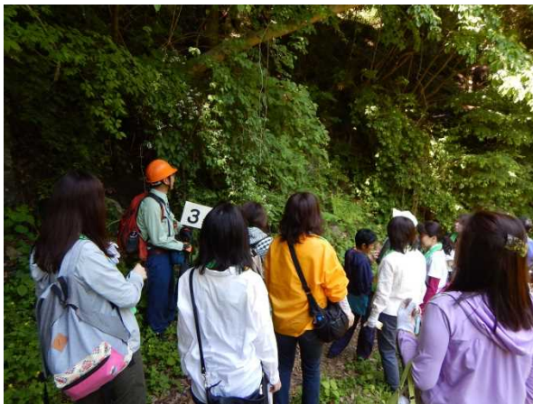
林道歩行時には、植物観察会も行いました。

また、作業の前後では、当署森林官による植物観察会を実施。新緑が鮮やかな森林の中で、有意義な時間を過ごせたようです。 ニッセイ相模の森では、植樹以降、久しぶりの活動となったようで、初めて訪れた人も多くいました。今回の活動を契機に、森林や自然に興味をもっていた方が1人でも多くなることを願っています。