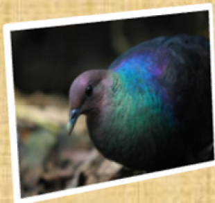
アカガシラカラスバト

なお、聳島については、観光等の目的での立ち入りの可否について、小笠原諸島森林生態系保護地域保全管理委員会で検討中です。