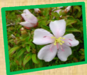
ハハジマノボタン