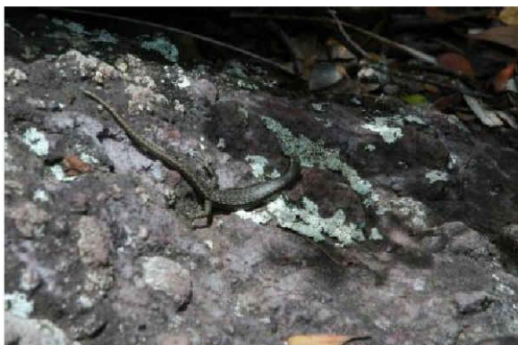
オガサワラトカゲ