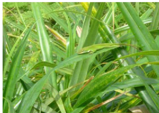
グリーンアノール