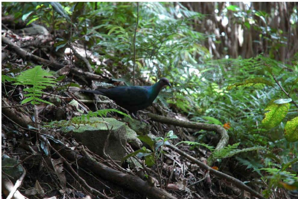
アカガシラカラスバト

一方、移入種として、ノヤギ、ノネコ、ノネズミ、グリーンアノール、ニューギニアヤリガタリクウズムシなどが生息しており、固有種等の生息に大きな影響を及ぼしています。