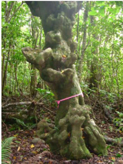
シマホルトノキ (コブノキ)

植物についても移入種の問題があり、特に、過去において薪炭用として移入したアカギ、モクマオウ等は固有植生に対する大きな脅威となっています。