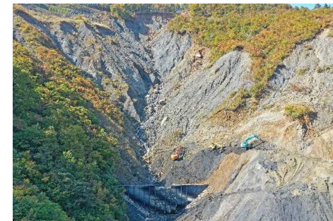
魚沼市只見川左岸（平成24年度より着手）