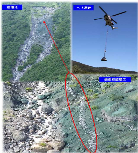
令和3年度に航空機を使用して実施した「袋型石詰筋工」