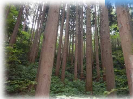
佐渡（伐期を迎えた官行造林）