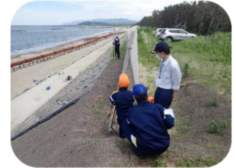
キャリア教育支援〈中学生職場体験〉 （村上支署）