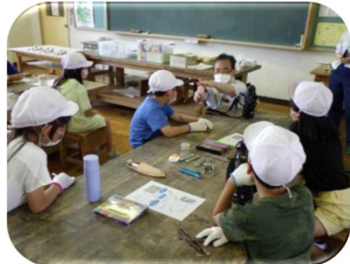
小学校への出前森林教室（中越森林管理署）