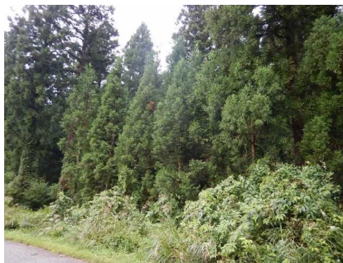
スギの樹下にスギを植栽した二段林

また、こうした森林整備により出材された間伐材などは、木材の安定供給に寄与するため、県産材として県内の市場や製材工場などに供給しており、令和5年度も引き続き地域の林業・木材産業に貢献します。