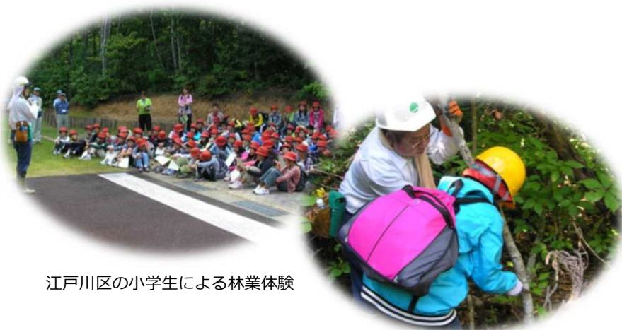
江戸川区の小学生による林業体験