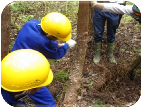
下刈り・間伐体験（上越森林管理署）