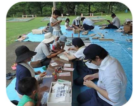
木工教室（村上支署）