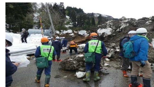
糸魚川市来海沢地区の地すべり災害 (令和3年3月4日発生) 災害箇所の現地調査の様子