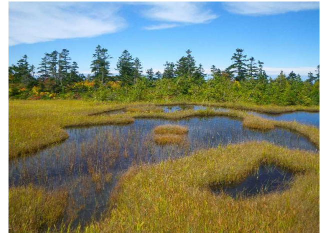
小松原湿原 (中越森林管理署(津南町))