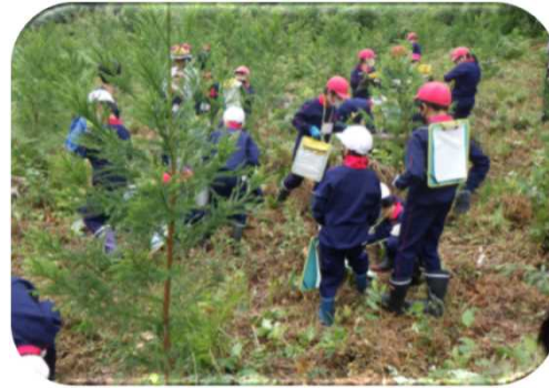
国有林での森林教室（中越森林管理署）