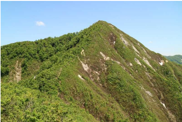
今年の干支「光兔山」 (村上支署(関川村))