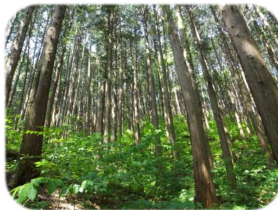
県内では珍しいヒノキ人工林（荒川峡鷹巣） （村上支署（関川村））