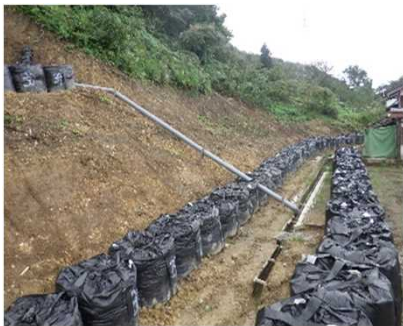
花立地区応急対策状況

令和5年度も、国交省、新潟県、村上市、関川村等の関係機関との情報交換や調整等を行いながら官民一体で早期復旧・復興に向け進めています。