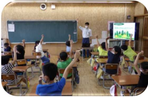
座学による森林教室（上越森林管理署）

地域や学校などと連携し、自然観察や林業体験などの森林教室・野外活動を各森林管理署、支署で実施しています。令和5年度も、各森林管理署で小学生等を対象に森林教室を実施します。