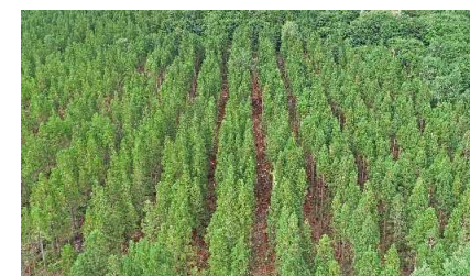
列状間伐(中越森林管理署)