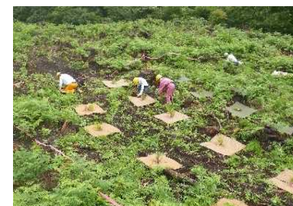
マット敷設による下刈省略試験地 (中越森林管理署)