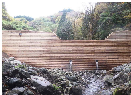
阿賀町 土倉山地区予防治山工事 (令和3年度施工) 木製残存型砕工の採用

これらに加え、「防災・減災、国土強靱化のための5か年加速化対策」に基づき、山地災害危険地区における治山対策や、国有林野内及び民有林の地すべり防止区域内での既施工箇所を対象に、治山施設の「長寿命化基本計画」に基づき、当該施設の補修・補強にも取り組んでいます。