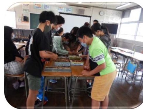
木工教室（下越森林管理署）