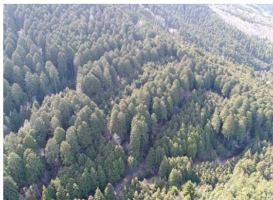
様々な齢級がモザイク状に混在する育成複層林 (茨城県内 森林技術・支援センターの例)