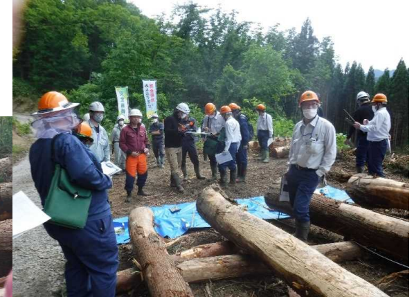
令和4年6月14日 下越森林管理署、村上支署合同採材現地検討会 (村上市笹平タへ国有林)