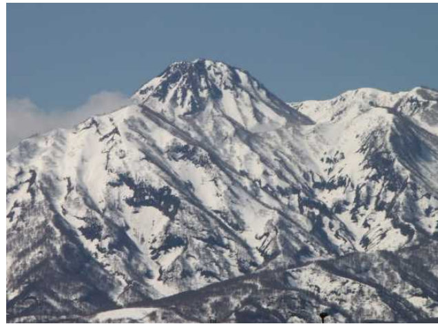
春の訪れを告げる妙高山「跳ね馬」の雪形 (上越森林管理署(妙高市))