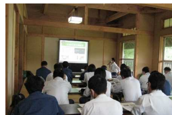
有害鳥獣捕獲（わな）研修

更に、被害林分における公益的機能維持と資源の循環利用が可能な森林施業を目的とし、獣害を受けにくいとされ、スギとは伐採周期が異なるヒノキアスナロをスギ林に樹下植栽するなどの試験地を設定しています。