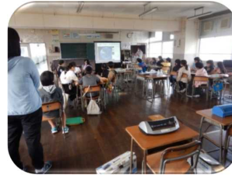
座学による森林教室（下越森林管理署）