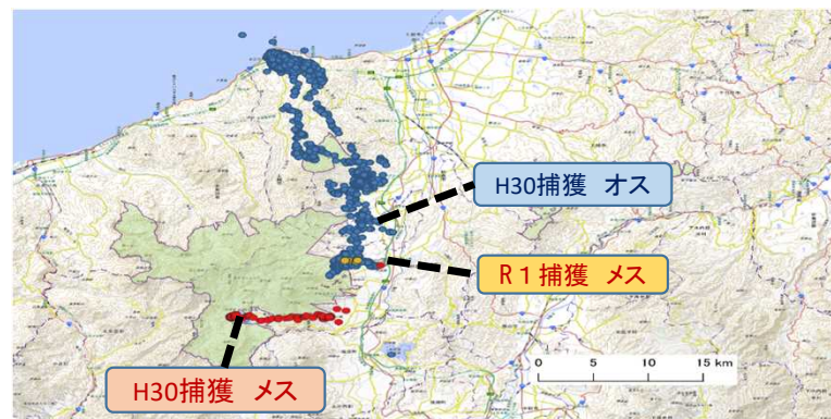
首輪を装着したシカのGPSデータ 分析の結果、シカの行動を把握

例年、県内の国有林職員を対象とした有害鳥獣捕獲（わな）研修を各署の持ち回りで実施しています。令和4年度は下越森林管理署管内において実施しました。講師は、シカ捕獲に関する知識を有する新潟県庁の職員及び新潟県猟友会に依頼しました。これまでの取組の結果、県内森林管理署職員で捕獲を行える資格を所有する者は40名ほどになりました。