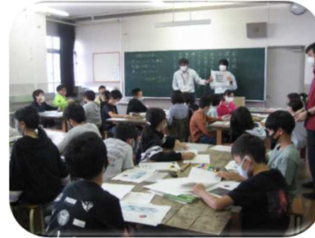
座学による森林教室（下越森林管理署）