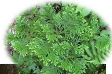
クマ剥ぎ被害を抑制するために ヒノキアスナロを樹下植栽した試験地