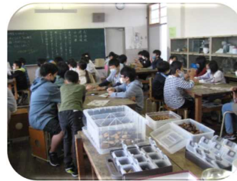
木工教室（下越森林管理署）