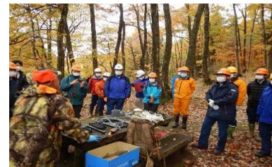
有害鳥獣捕獲（わな）研修

また、被害林分における公益的機能維持と資源の循環利用が可能な森林施業を目的とし、獣害を受けにくいとされ、スギとは伐採周期が異なるヒノキアスナロをスギ林に樹下植栽するなどの試験地を設定しています。