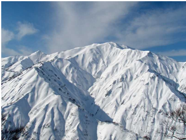
飯豊連峰の最北端「杵差岳」 (村上支署(関川村))