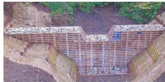
五泉市 神戸川地区予防治山工事 (令和2年度施工) 木材を利用した木製床固工の採用

上越森林管理署では、令和3年3月に民有林で発生した糸魚川市来海沢地区の地すべり災害において、県の現地検討会及び災害対策部会に参画するとともに、県の出先機関に対し、応急対策に使用可能な資材等の情報提供をしました。また、ドローン調査等の協力要請にも応えていく旨連絡調整を行いました。