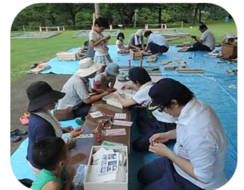
木工教室（村上支署）