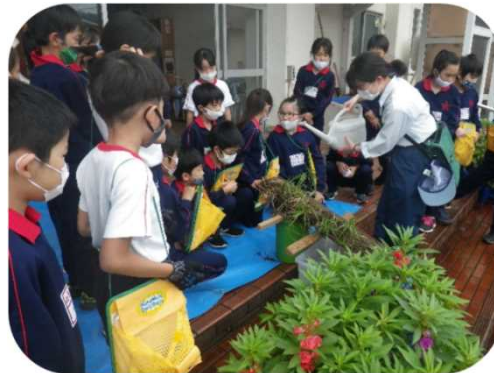
小学校への出前森林教室（中越森林管理署）