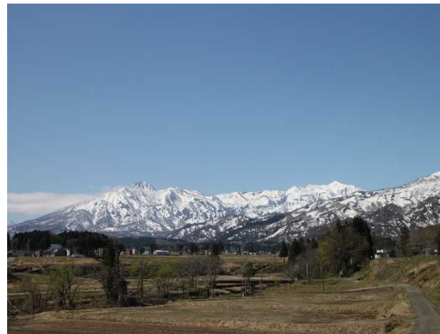
「跳ね馬」と妙高連峰 (上越森林管理署(妙高市))