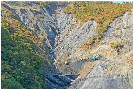
魚沼市只見川左岸（平成24年度より着手）