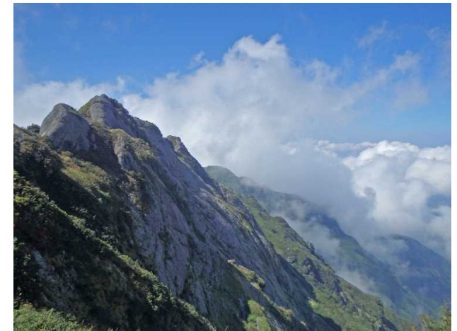
霊峰八海山 (中越森林管理署(南魚沼市))