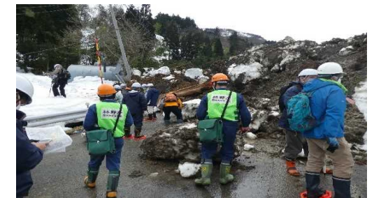
糸魚川市来海沢地区の地すべり災害 (令和3年3月4日発生) 災害箇所の現地調査の様子