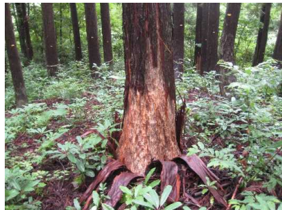
クマ剥ぎ被害にあった造林木

なお、平成29年度からは、新潟県内各(支)署と新潟大学、新潟県及び関係機関が情報共有を行うなど連携を図っています。