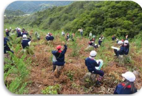
国有林での森林教室（中越森林管理署）