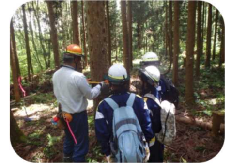
キャリア教育支援<中学生職場体験> （村上支署）