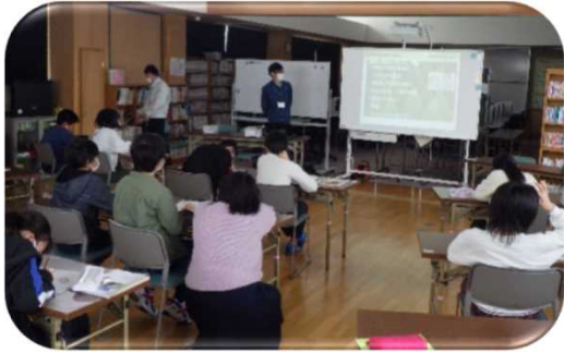
座学による森林教室（上越森林管理署）

地域や学校などと連携し、自然観察や林業体験などの森林教室・野外活動を各森林管理署、支署で実施しています。