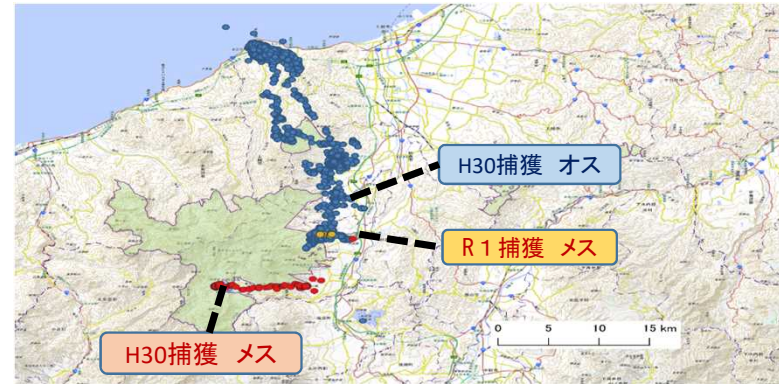
首輪を装着したシカのGPSデータ 分析の結果、シカの行動を把握

例年、県内の国有林職員を対象とした有害鳥獣捕獲（わな）研修を各署の持ち回りで実施しています。令和3年度は中越森林管理署管内において実施しました。講師は、シカ捕獲に関する知識を有する新潟県庁の職員及び新潟県猟友会に依頼しました。これまでの取組の結果、県内森林管理署職員で捕獲を行える資格を所有する者は40名になりました。