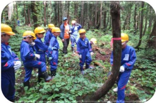
下刈り・間伐体験（上越森林管理署）