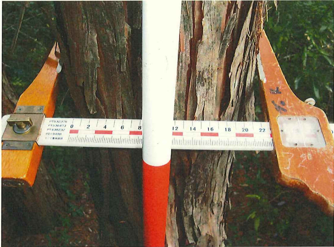
ヒノキの生育状況