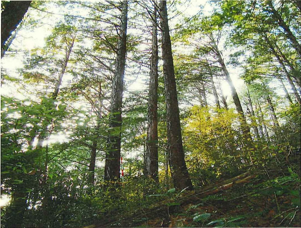
ヒノキの林況(林地中段)