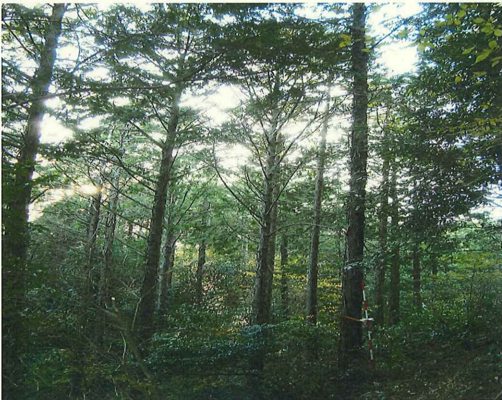
ヒノキの林況(林地上段)