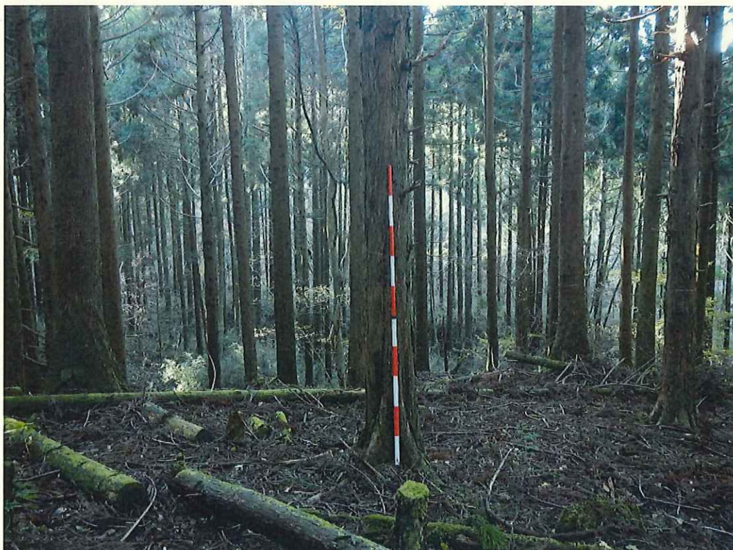
ヒノキの林況(林地下段)