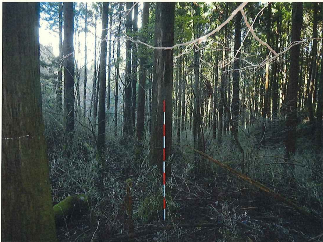
スギの林況(林地中段)

所在地: 静岡県駿東郡小山町大字新紫 猪鼻山国有林555い林小班 (旧 静岡県駿東郡小山町大字新紫 猪鼻山国有林155い林小班)