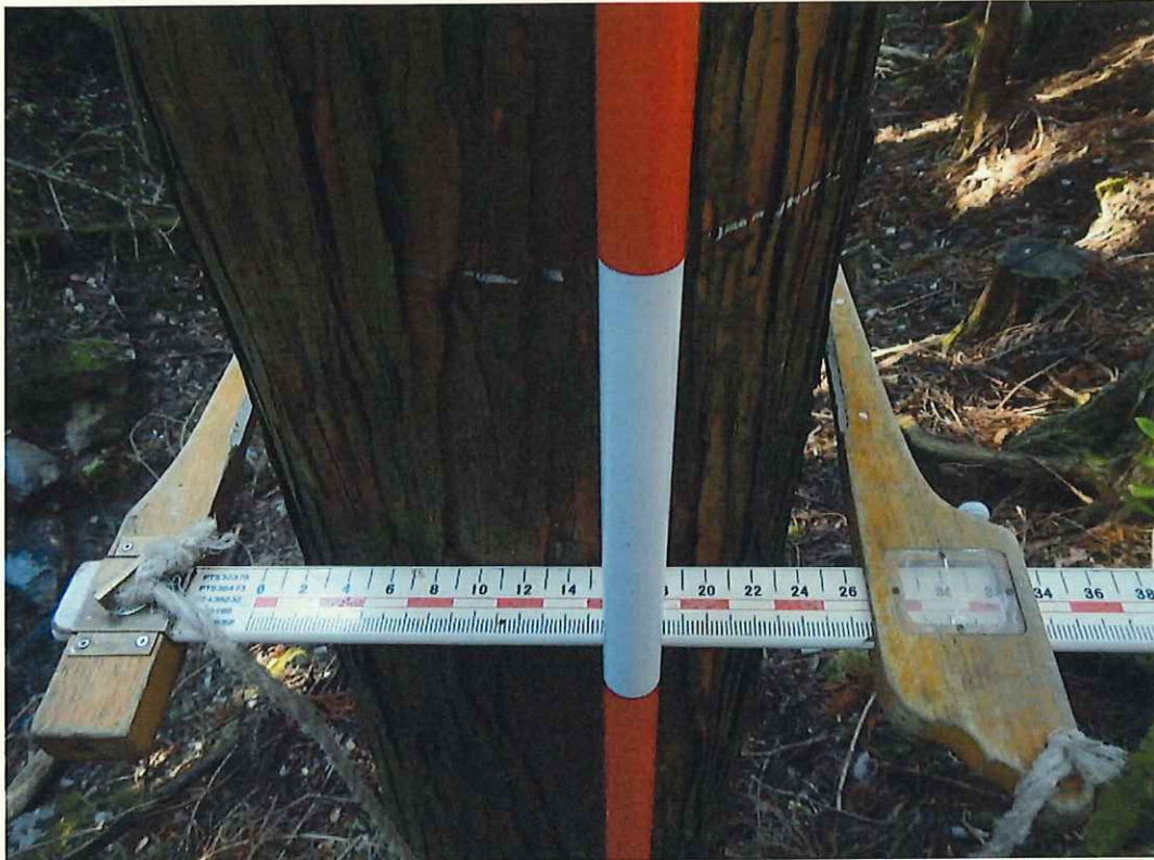
ヒノキ分収木の生育状況

所在地: 静岡県駿東郡小山町大字新紫 猪鼻山国有林555い林小班 (旧 静岡県駿東郡小山町大字新紫 猪鼻山国有林155い林小班)