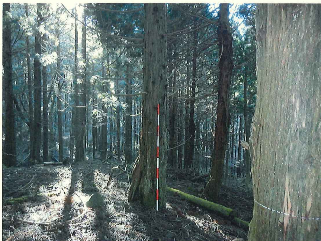
ヒノキの林況(林地上段)