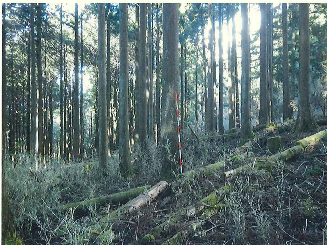
スギ林況(林地上段)