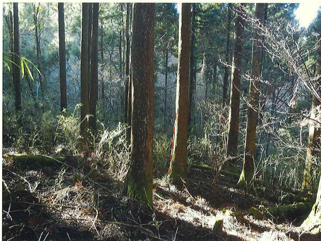
スギの林況(林地下段)