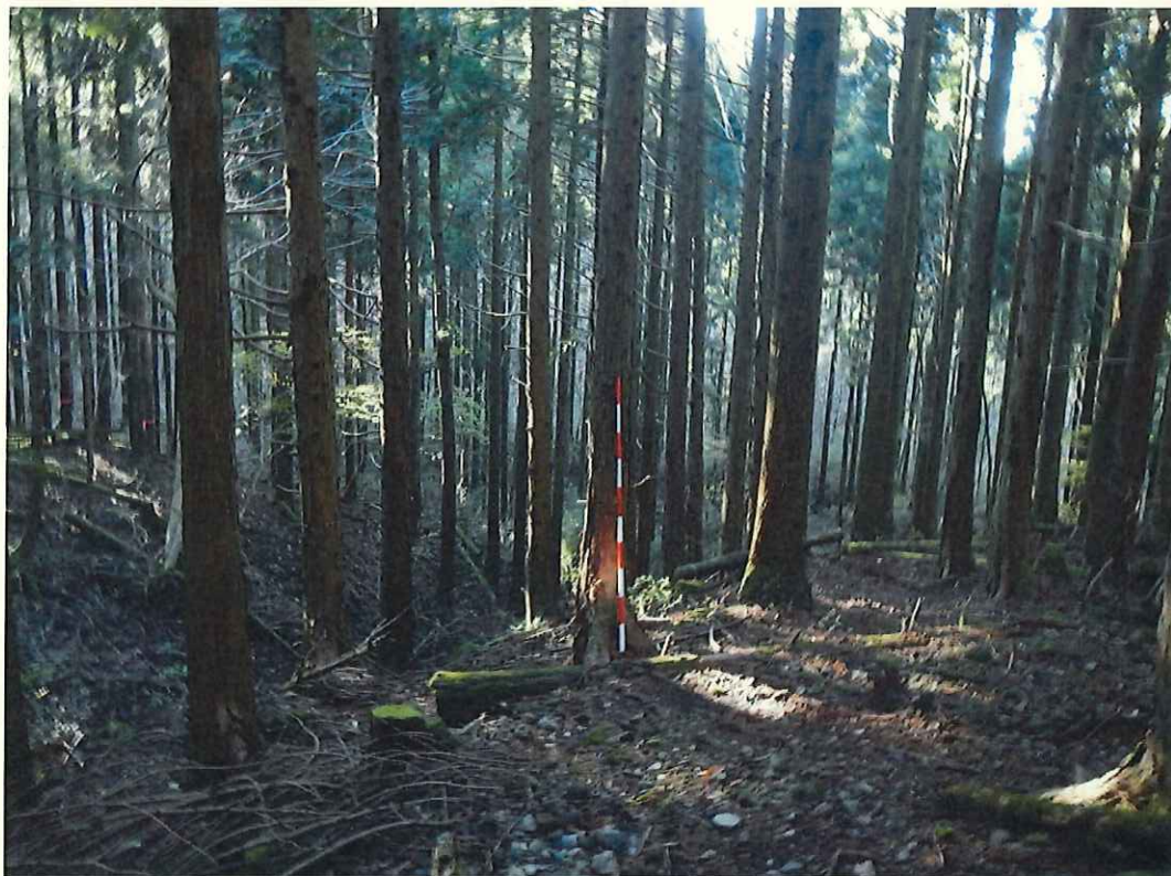
ヒノキの林況(林地中段)

契約番号： 静岡県駿東郡小山町大字新紫 猪鼻山国有林555い林小班 (旧 静岡県駿東郡小山町大字新紫 猪鼻山国有林155い林小班)