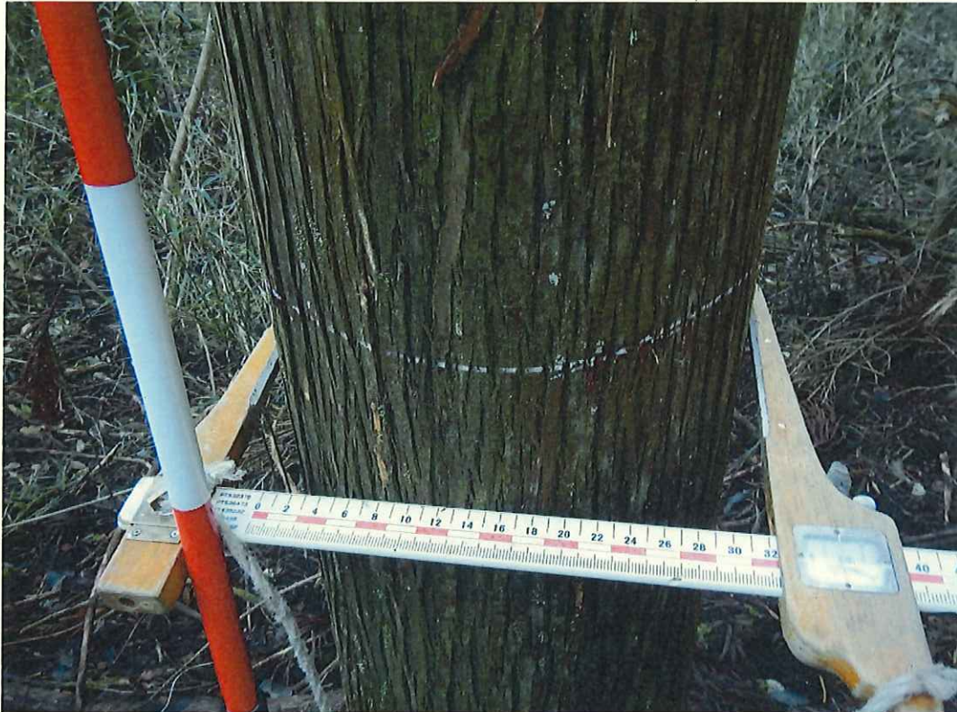
スギ分収木の生育状況

所在地: 静岡県駿東郡小山町大字新紫 猪鼻山国有林555い林小班 (旧 静岡県駿東郡小山町大字新紫 猪鼻山国有林155い林小班)