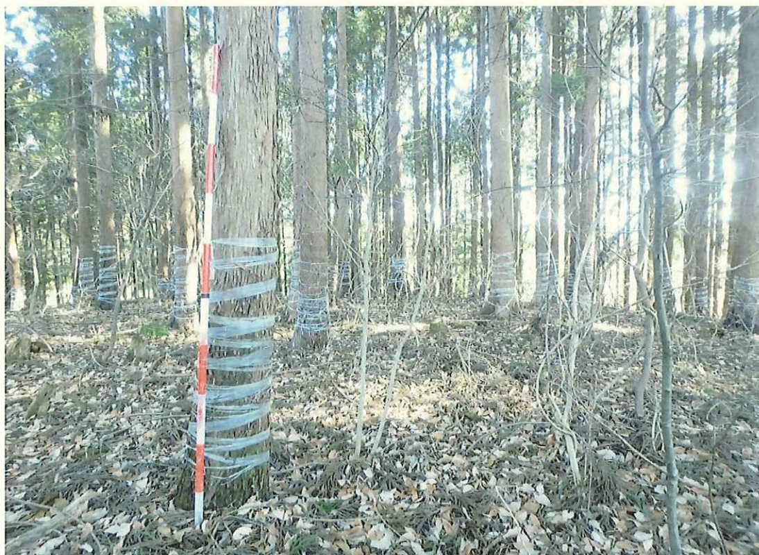
スギの林況(林地上段)