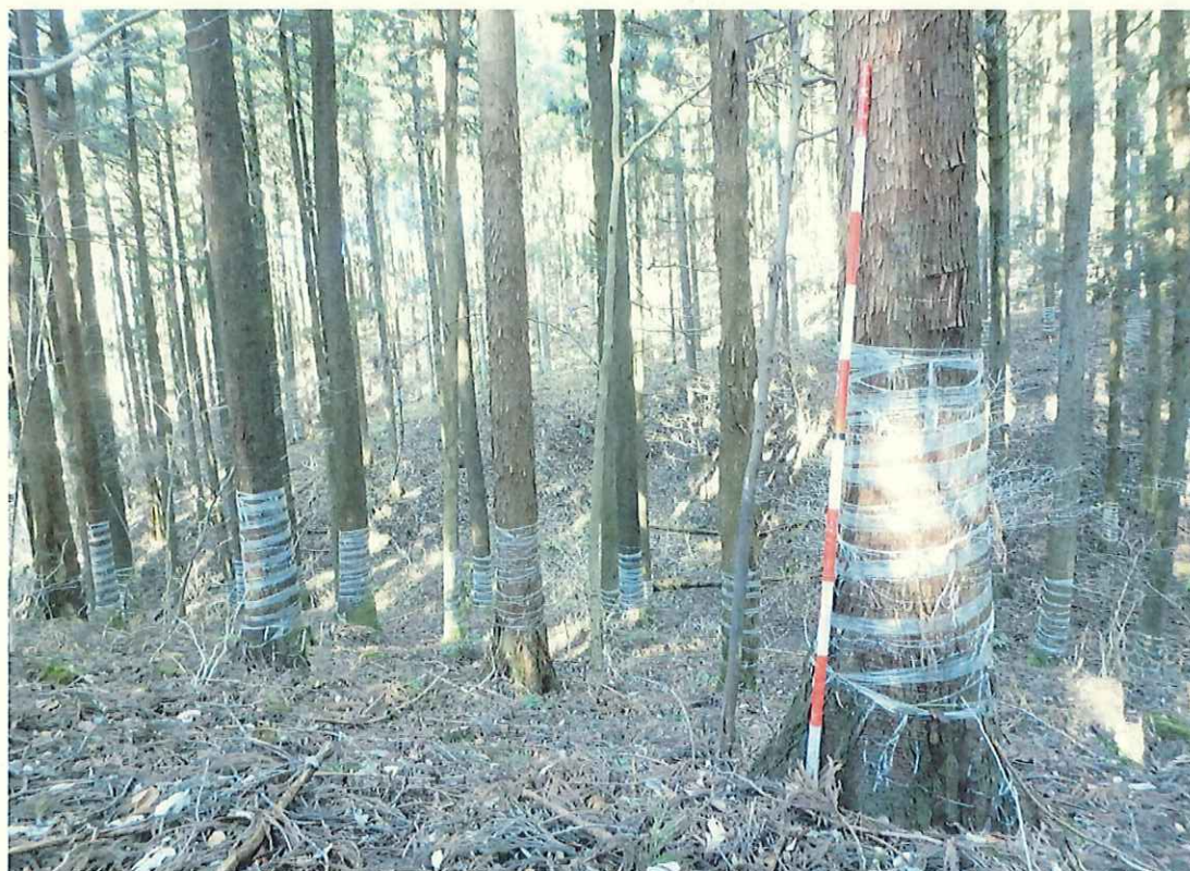
スギの林況(林地下段)