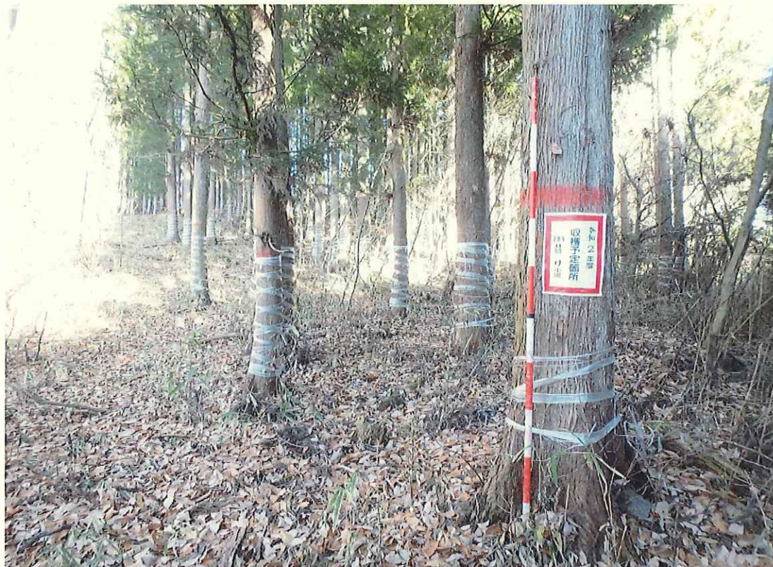
スギの林況(林地中段)