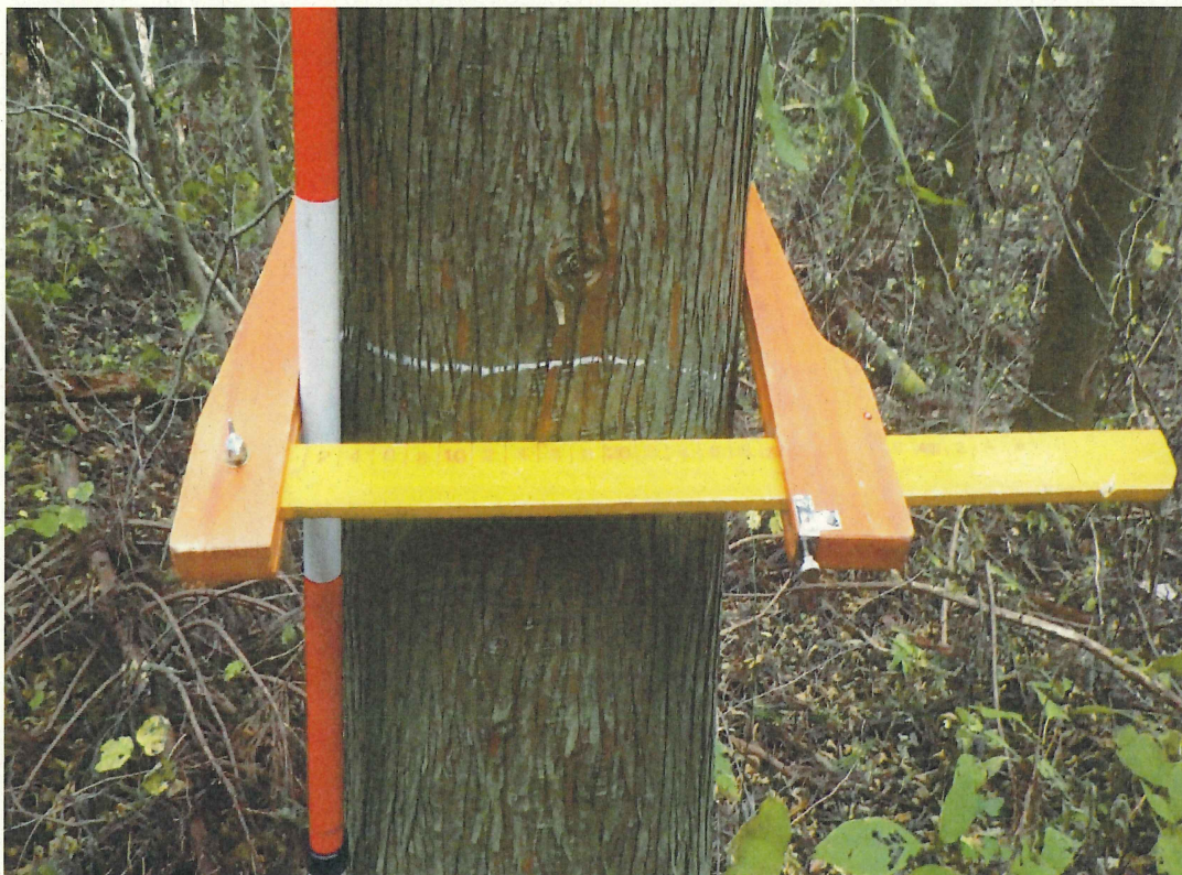
スギ分収木の生育状況

所在地: 福島県相馬郡飯舘村大字大倉 湯船国有林2226林班ろ2小班 (旧 福島県相馬郡飯舘村大字大倉 湯船国有林226林班ろ1小班)