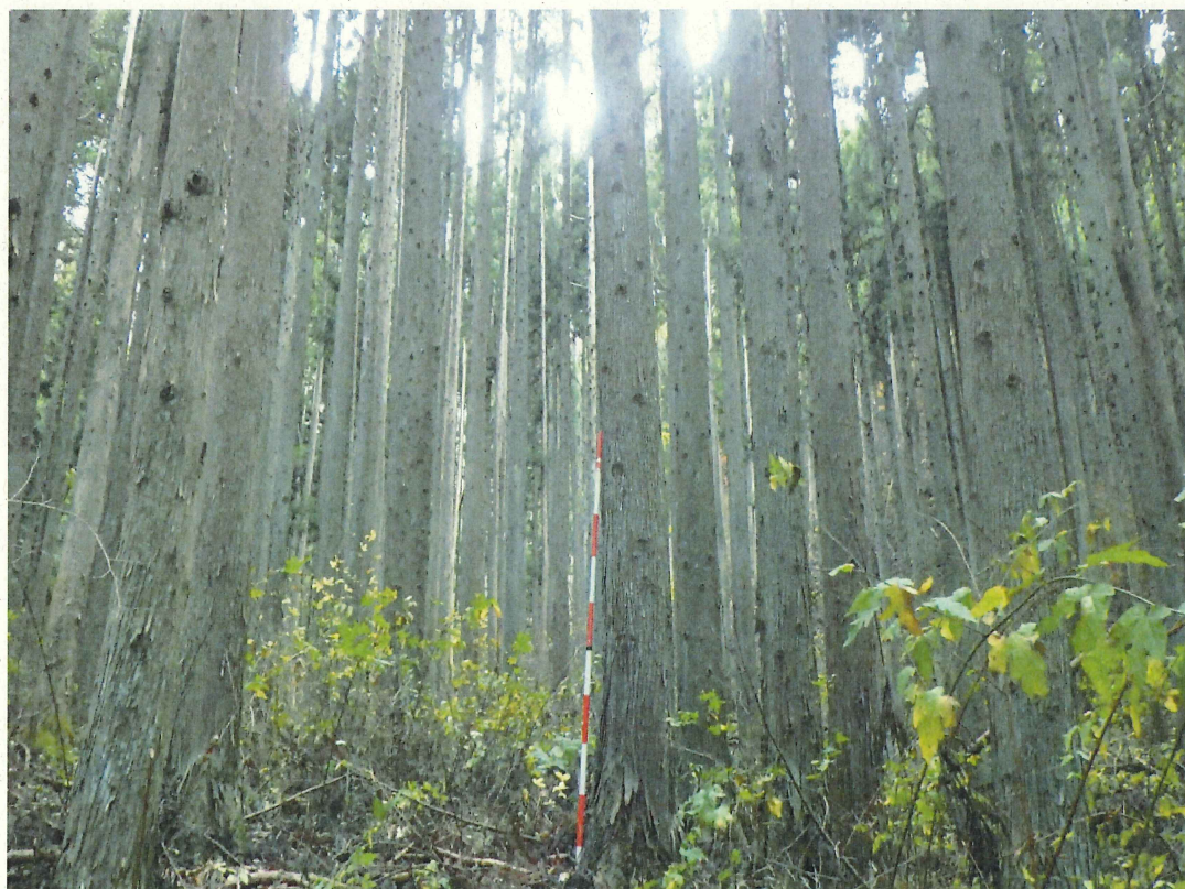
スギの林況(林地 下段)