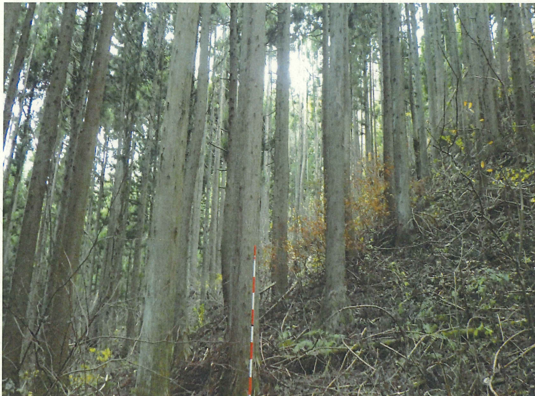
スギの林況(林地中段)

所在地: 福島県相馬郡飯舘村大字大倉 湯船国有林2226林班ろ2小班 (旧 福島県相馬郡飯舘村大字大倉 湯船国有林226林班ろ1小班)