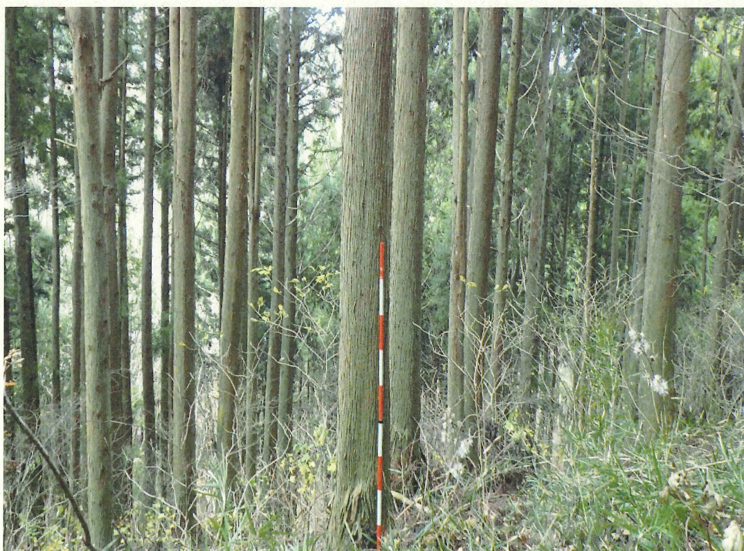
スギ林況(林地上段)