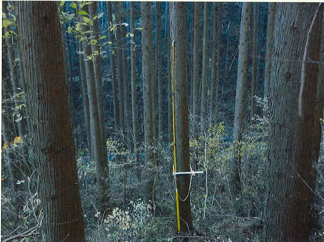
スギの林況(林地上段)