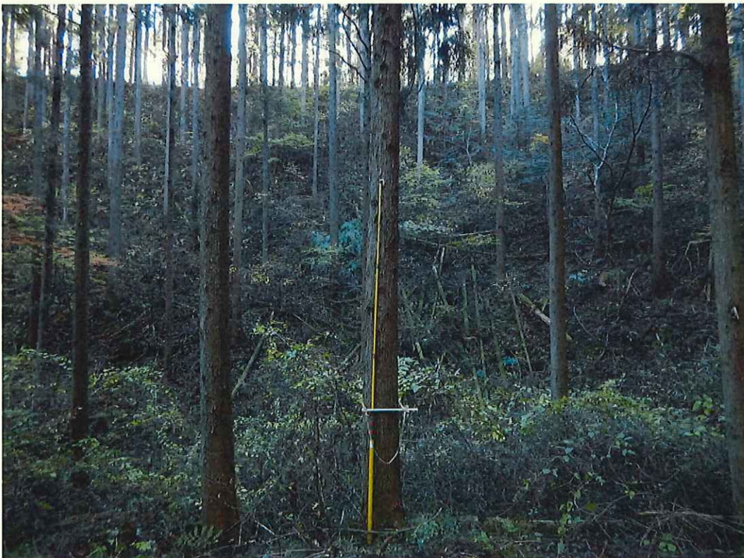
スギの林況(林地下段)