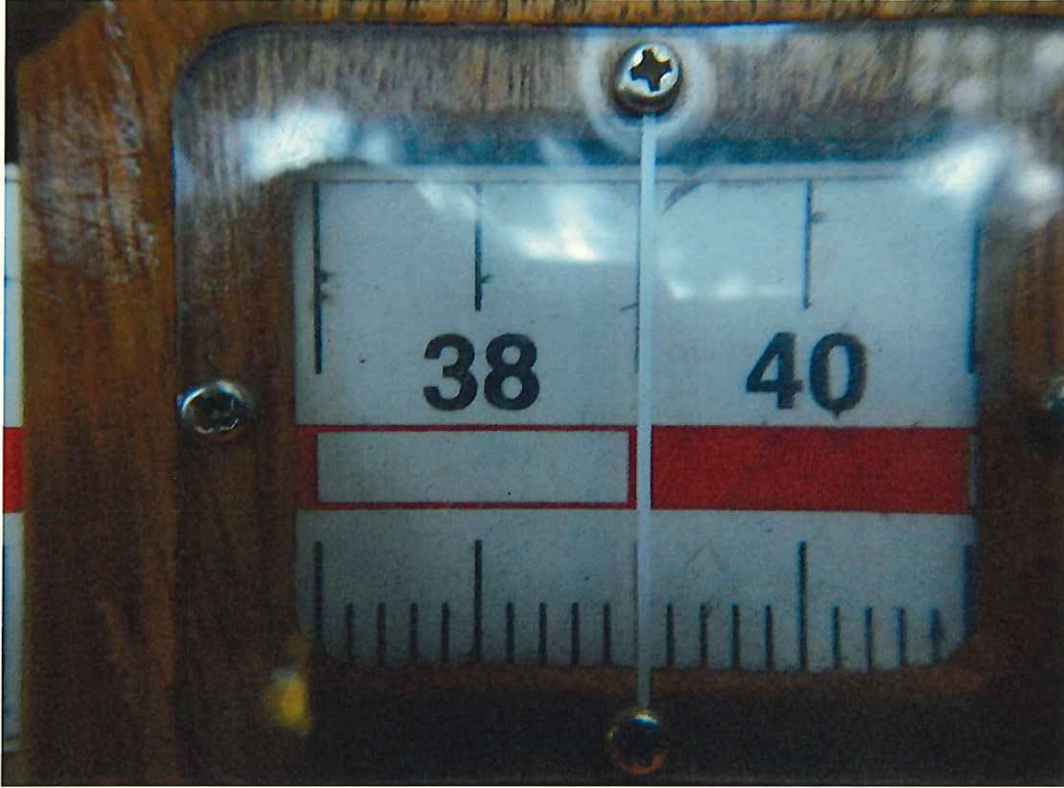
スギ分収木の生育状況

所在地: 茨城県久慈郡大子町芦野倉 高鳥山国有林2113に2林小班 (旧 茨城県久慈郡大子町芦野倉 高鳥山国有林113に林小班)