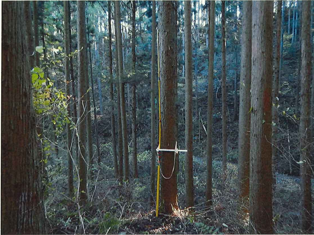
スギの林況(林地中段)

所在地: 茨城県久慈郡大子町芦野倉 高鳥山国有林2113に2林小班 (旧 茨城県久慈郡大子町芦野倉 高鳥山国有林113に林小班)