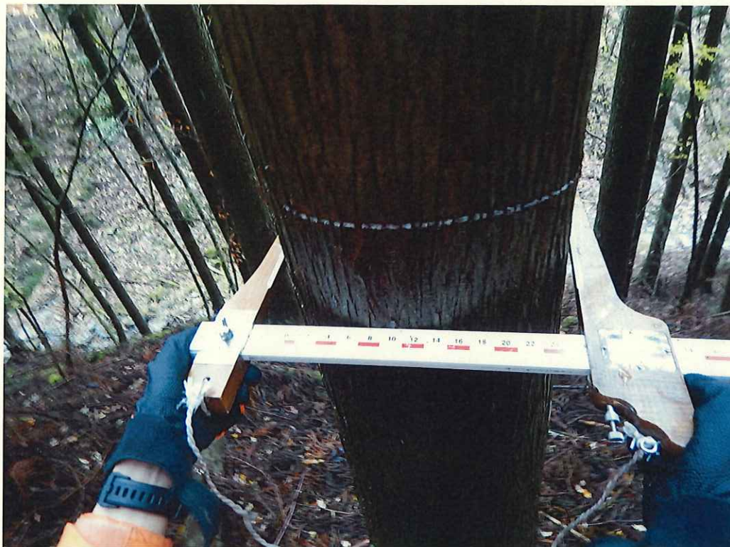
スギ分収木の生育状況

所在地: 神奈川県足柄上郡山北町世附 世附国有林122ろ1林小班 (旧 神奈川県足柄上郡山北町世附 世附国有林122ろ林小班)