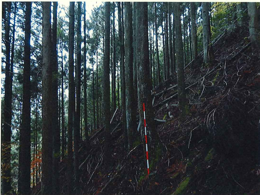
スギの林況(林地中段)

所在地: 神奈川県足柄上郡山北町世附 世附国有林122ろ1林小班 (旧 神奈川県足柄上郡山北町世附 世附国有林122ろ林小班)