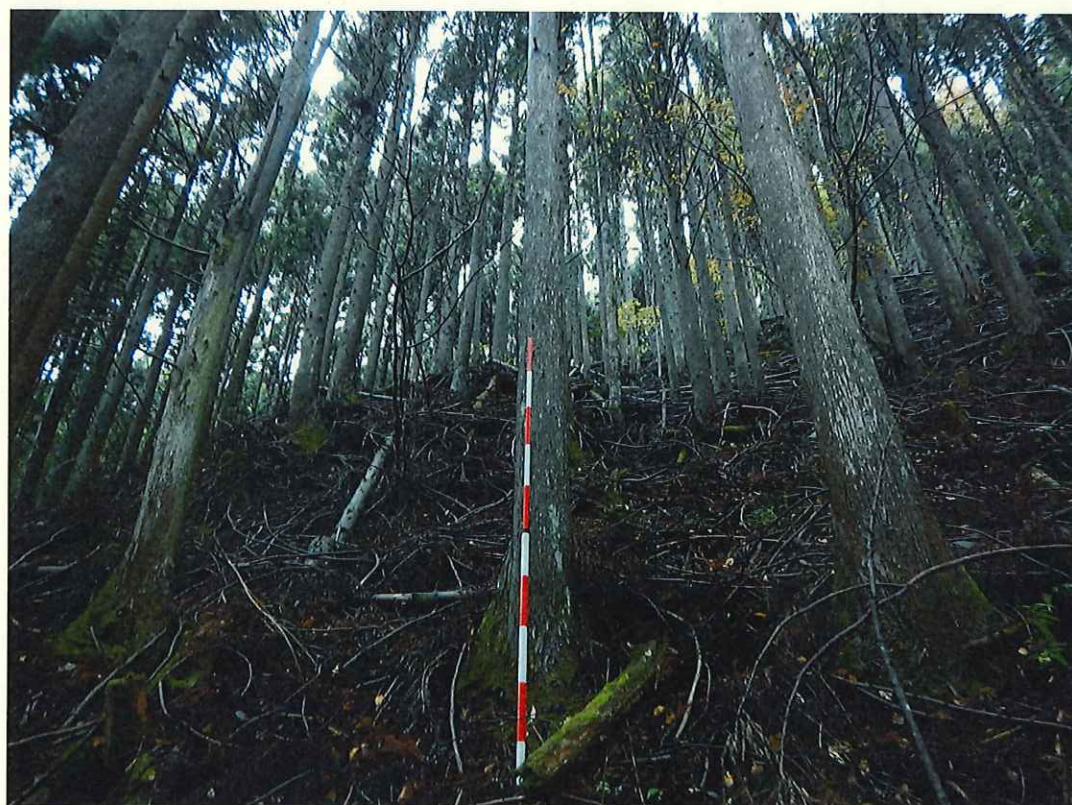
スギの林況(林地下段)