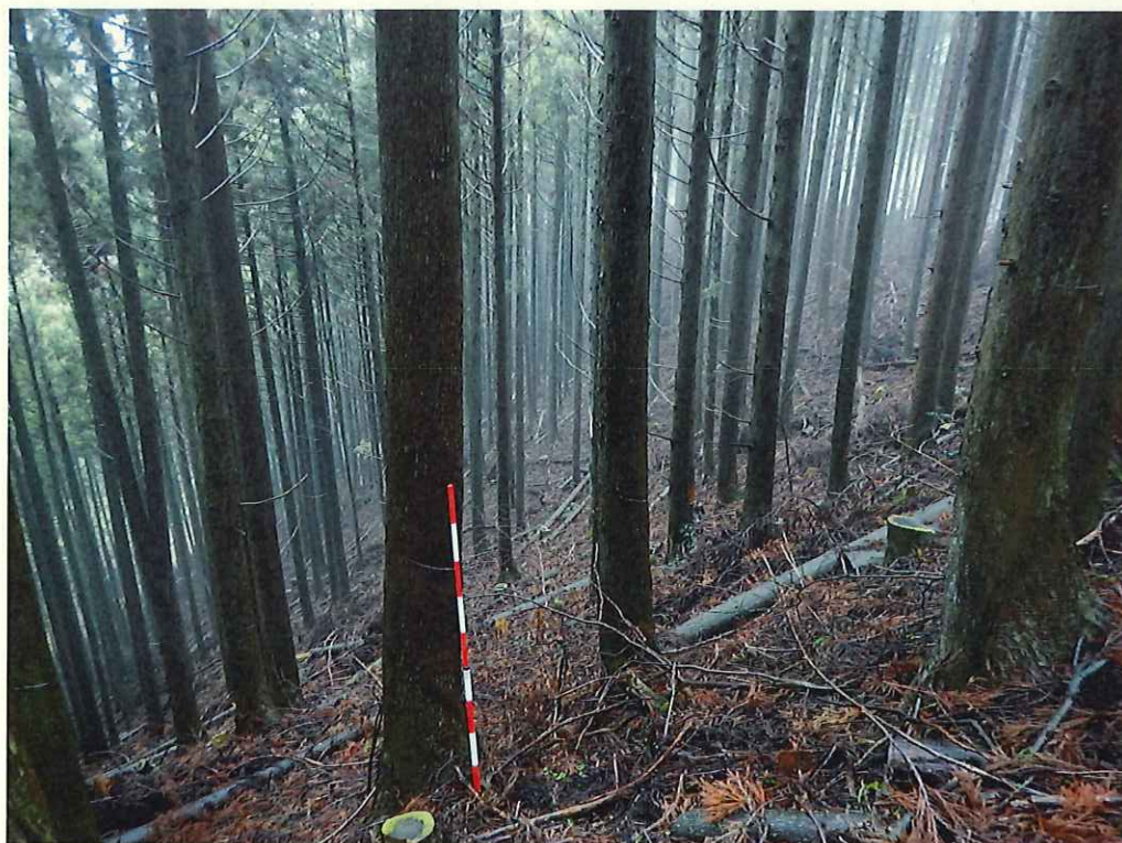
スギ林況(林地上段)