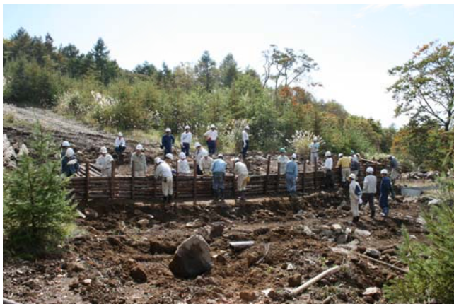
ボランティアによる木柵・水路設置

地域の自治体、関係機関及びボランティアと連携して、これらの素材を生かし、地域の活性化に少しでも役立つように取り組んでいきたいと考えています。