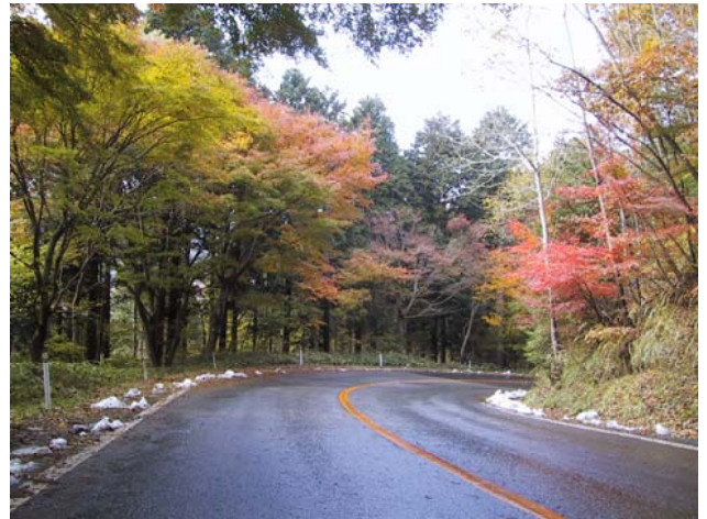
紅葉時の「日塩もみじライン」

しかしながら、40年近くを経過し、繁茂する樹木によって眺望が妨げられる状況になったため、平成12年から14年にかけて、当時の藤原町、県道路公社及び当署で協議会を設置し、学識経験者の意見を聞いたうえで景観を確保する森林整備を実施しました。この結果、7年を経過した現在も、日光連山を一望する眺望は確保されています。今後は、沿線のモミジに陽光を多く当て、色づきを良好にするための検討も必要ではないかと考えています。