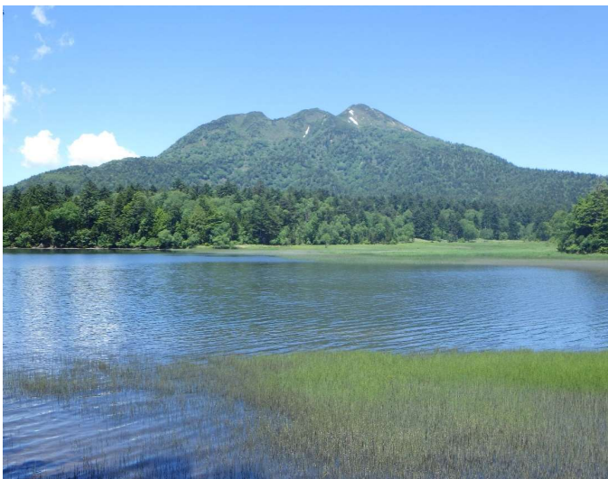
尾瀬沼から燧ヶ岳がきれいに見えていました。