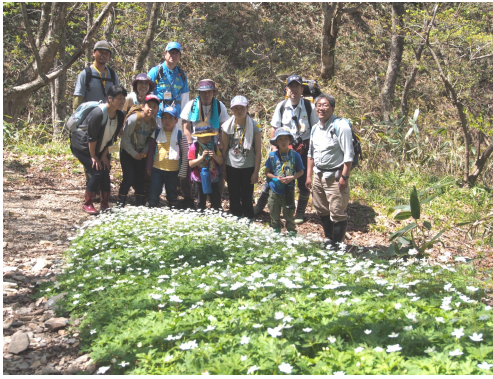
春の自然散策（旧三国街道のニンソウ）

赤谷の森には、新潟と群馬を結ぶ街道として江戸時代以前から利用されてきた旧三国街道があります。現在は登山道と