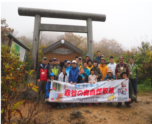
秋の自然散策（御坂三社神社にて）

冬の自然散策は、2月4日（日曜日）にみなかみ町相俣にある「いきもの村」で開催しました。スノーシュー体験をしながら、樹木の冬芽やウサギやキツネ、カモシカ、テンなどの動物の足跡や糞などの観察を行いました。散策の後は、猿ヶ京温泉にある「民話と紙芝居の家」に移動し、猿ヶ京に昔から伝わる心がほっこりする民話の語りや、二千点を超える懐かしい紙芝居の中から数点を語り部さんに実演していただきました。