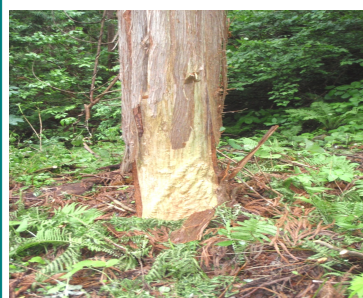
シカによる剥皮被害

なったこともあり、私自身も挑戦しましたが非常に登りごたえのあるコースです。また、唐倉山は標高1176mと標高はそれほどではないものの、山開きが10月に行われる珍しい山です。昨年はあいにくの雨で式典のみ行われましたが、山を愛する多くの人で賑わいました。 伊南川は鮎釣りが盛んです。全国から多くの釣り客が訪れ、シーズン中には「伊南川あゆまつり」も開催されます。冬季は豪雪地帯である特徴を生かして、スキーやクロスカントリーなどのウィンタースポーツが盛んに行われており、伊南森林事務所管内の国有林もスキー場(レクレーションの森)として貸し付けられています。 伊南森林事務所管内の人工林は全国的な傾向と同様に主伐期を迎えています。林業の低コスト化が重要課題となっている中、平成29年9月に木材の生産性向上に向けた現地検討会を開催しました。木材生産現場に