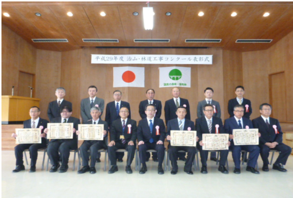
表彰記念写真（関東森林管理局）

以上の4件のほか、優良な工事として選考された14件の工事は、関東森林管理局長賞を受賞しました。また、大臣賞、長官賞を受賞した工事の現場代理人等が関東森林管理局長賞を受賞しました。