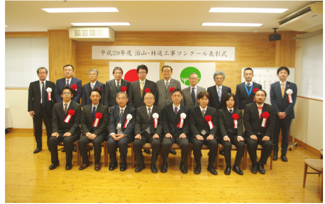
表彰記念写真（東京事務所）