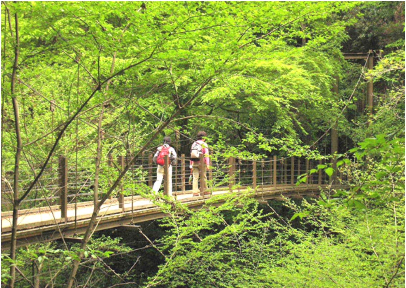
高尾山自然休養林