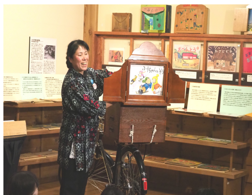
昔懐かしい紙芝居

赤谷森林ふれあい推進センター http://www.rinya.maff.go.jp/kanto/kanto/akaya_fc/index.html