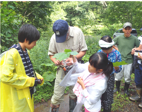
夏の自然散策（夏休み親子いきもの観察会）

秋の自然散策は、10月21日（土曜日）に、赤や黄色に染まる旧三国街道で開催しました。春の散策とは違うルートで紅