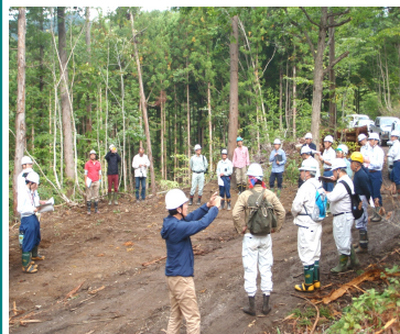
生産性向上検討会の様子