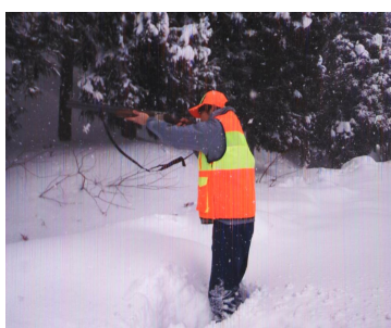
猟銃を構える筆者

おける作業道の作設や伐採などの作業をいかに効率的に行っていくかを学び、地域全体の林業技術、木材生産能力を底上げしていこうというものです。 当日は森林組合やNPO法人など地元南会津町が主催する南会津林業成長産業化推進会議のメンバーの方々に多く参加いただきました。参加した皆さんからは地域林業の発展に向けた強い意気込みが感じられ、地域と連携した取組を実施することの重要性を感じました。 最近、当事務所管内でもシカが樹皮を食べたり、角でこすることによって樹皮が剥がされる被害(剥皮被害)が見られるようになっており、シカの生息域が確実に広がっていることを実感しています。その対策として、トウモロコシが原料で生分解性でありながら、5年は機能を維持して耐久性も高いリンロンテープを立木に巻いて被害の拡大を防いでいくこととしていきます。猟友会の方に非常勤