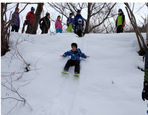
冬の自然散策（土手の滑り台）