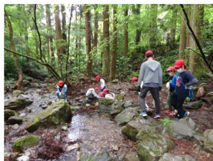
沢に生息する生物等の観察

森林にはどのような働きがあるのか、林内にはどのような草花があるのか、沢の水はどこから流れてくるのか、人工林と天然林の違いなどについて、普段体験したことがない森林の中で児童たちは直接自然に触れ、肌で感じながら学習します。