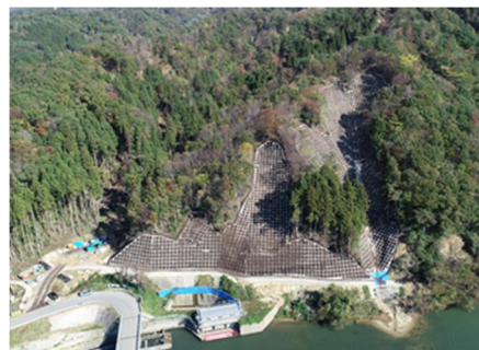
集中豪雨による被害箇所の復旧状況（新潟県村上市）