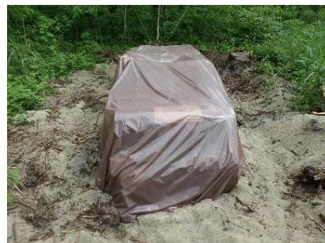
衛生伐：松くい虫被害木を伐倒、くん蒸処理を実施