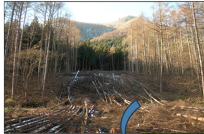
人工林（カラマツ）を伐採 （群馬県みなかみ町）