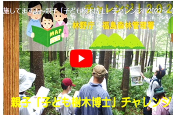
管内の取組を動画（YouTube）で紹介