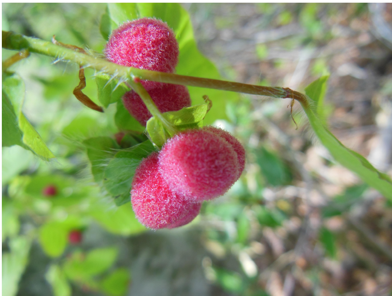
「旧三国街道（ブナの葉につく虫こぶ）」赤谷森林ふれあい推進センター

前橋市岩神町4-16-25 TEL.027-210-1158 https://www.rinya.maff.go.jp/kanto/