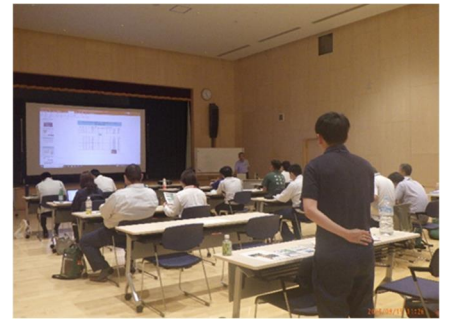
ナラ枯れ被害対策講習会