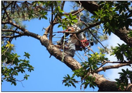
リュウキュウマツ（外来種）の特殊伐採 （東京都小笠原村）

小笠原諸島の国有林におけるリュウキュウマツ等の外来種駆除等による原生的な森林等の保護・管理に取り組みます。また、地域と連携したイヌワシの営巣環境保全等の生物多様性の保全・復元を図る森林施業に取り組みます。