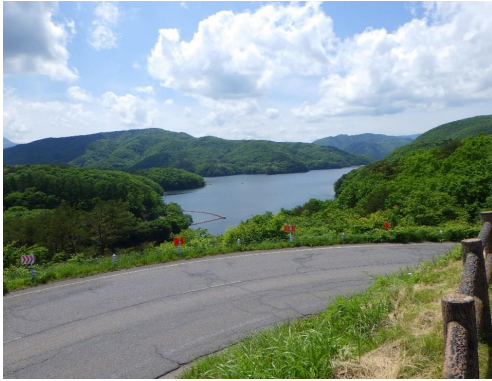
展望台から望む羽鳥湖ダム

私の勤務する大平森林事務所は、福島県中通り中部に位置する天栄村の国有林約1万haを管理しています。天栄村は、昭和30年に湯本村、牧本村、大里村、広戸村が合併した際に、村の中央部にある天栄山から村名がつけられたと聞いています。天栄村は、釈迦堂川流域と鶴沼川流域にまたがる東西に伸びた形が特徴で、古くから会津と中通りを結ぶ重要な交通の要衝です。また、当事務所管内には、アースダム（主に土を用い、台形に築いたダム）としては全国屈指の規模を誇る、羽鳥湖ダムがあります。白河地域に貴重な農業用水を供給しているほか、ダム周辺には、国有林を活用したサイクリングロードやスキー場等多くのレクリエーション施設が整備されています。近くの天栄、湯本、二岐地区には温泉もあり年間を通して様々な観光を楽しむことができます。今年こそは私も参加し、山頂の大パノラマを堪能したいと思っております。平安時代からの流れをくむ御鍋神社もあり、平成12年林野庁「森も巨人たち100選」選出されたサワラの木も