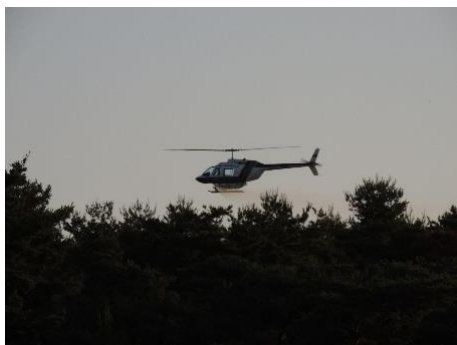
特別防除(空中散布)6月上旬 村上市と合同でヘリにより薬剤を散布