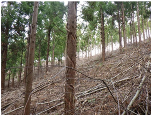
令和5年度に双葉郡檜葉町の国有林で実施した森林整備 (除伐による森林の保育作業)

東日本大震災で被災した地域の森林の復旧、林業の再生に向けた各種事業を引き続き実施します。福島県相双地域の避難指示が解除された区域の国有林において、空間線量率等のモニタリングを実施するとともに、森林整備や路網の新設・改良工事を実施します。