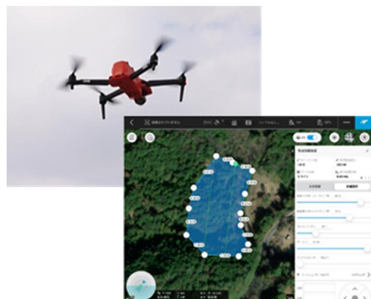
ドローンの自動運転による面積計測