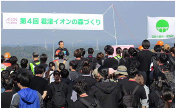
市民団体等との森林づくり活動 (千葉県君津市)

地域住民等による森林づくりや森林環境教育等のためのフィールド提供等の活動支援、動画を活用した広報や地域との意見交換等による報発信等を行います。