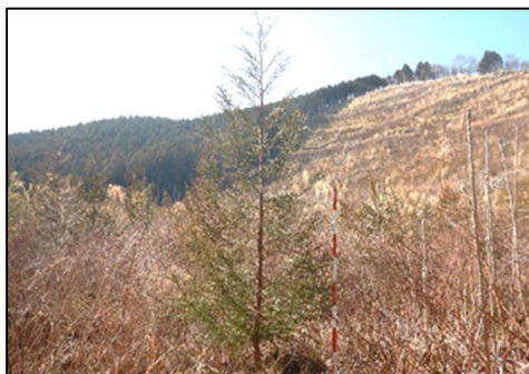
3年間で4mに成長したスギ特定苗木

あわせて、これら「新しい林業」に向けた国有林の先駆的な取組成果等を民有林等林業関係者に展開することで、地域の林業振興へ貢献します。