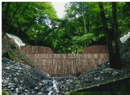
木製残存型枠を使用したコンクリート谷止工

また、災害発生時には、早期の被害把握に向けたヘリコプター調査や職員派遣（MAFF-SAT）による技術支援を行います。