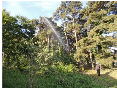
ホース（左）、スパウター（上）で薬剤を散布

当時をしのぶ茶会は、コロナ禍で中断していましたが、昨年、4年振りに開催されました。