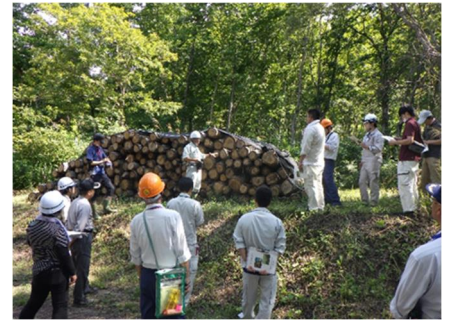
おとり丸太誘引状況共同調査見学会

平成30年度からは、只見町役場と合同でおとり丸太の効果の検証を合同で行っており、また、令和5年度には、只見町役場・南会津農林事務所の協力を得て、会津地域の行政機関を対象とした「おとり丸太誘引状況共同調査見学会」及び「ナラ枯れ被害の実態と防除法」の講習会を開催しました。