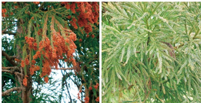
一般的な品種の枝