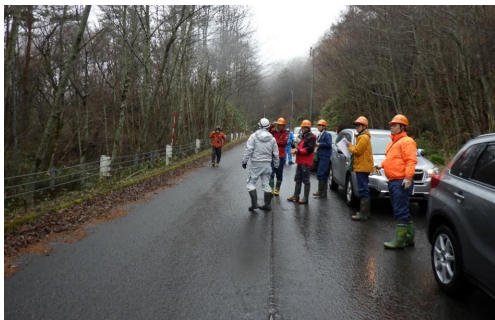
小水力発電事業の説明を受ける筆者ほか

事業については、造林、製品生産、立木販売と多岐にわたっていますが、森林官1人のため非常勤職員や支署の職員の力を借りながら業務を行っております。また、ここ数年、小水力発電や風力発電といった開発行為を伴う新規貸付案件等の管理案件が増え、支署担当者と法令等の確認に苦慮しながら業務をしているとことです。また、造林地ではシカによる食害も見受けられることから、センサーカメラによる定点観測を行い、シカの繁殖状況を調べ、今後の対策を考えることにしております。