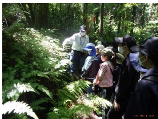
森林散策_林内の草花を観察

昼食をキャンプ場で食べ、午後からは室内にてスライドで森林の仕組みや役割、自然とのかわり方などについて学びます。その後、屋外にて間伐したスギの丸太切り体験を行います。