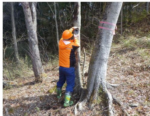
センサーカメラ設置中の筆者

最後に、当事務所管内は人工林より天然林が多いことから、次の世代にも引き継げるよう公益的機能の発揮を重視した管理経営を目指し、国有林がもっと親しみやすい場所になるよう、地元住民の皆さんの協力を得ながら、取り組んでいきたいと思っております。