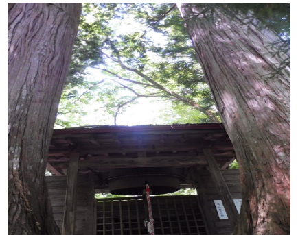
「森の巨人たち100選」のサワラの木