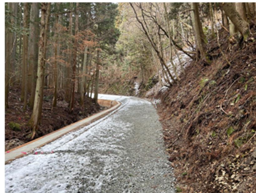
令和5年度に実施した大富林道改良工事（南相馬市）