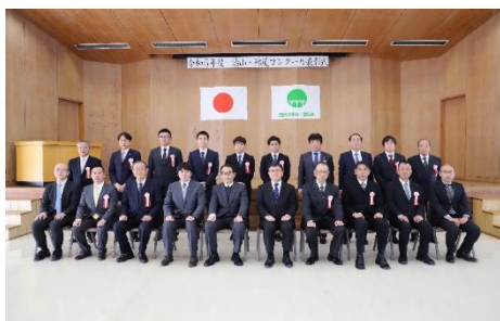
局長賞の授賞者（治山工事部門）