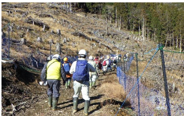
パッチディフェンスの設置状況