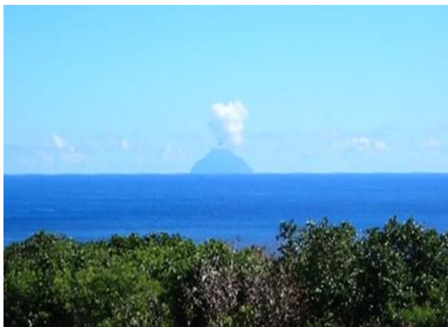
硫黄島から望む南硫黄島