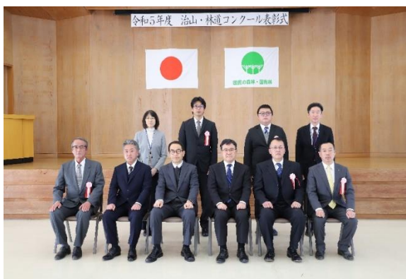
局長賞の授与者（林道工事部門）