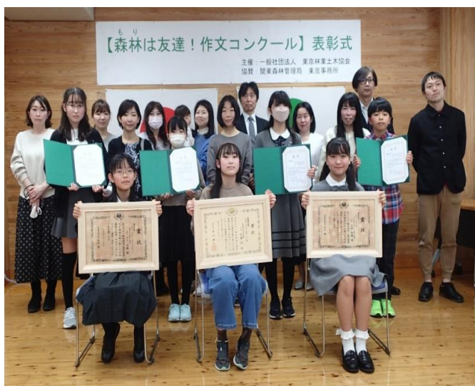
受賞者とその保護者