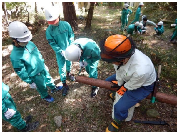
森林管理署等で行われた森林教室

このほか、木を切るの悪いことだと思っていたけど、木は持続可能で適切に切って使うことが大事と学んだという作文、高尾山だけでイギリス全土に生息生育する動植物と同じ数があることに驚いたという作文など、力作揃いでした。