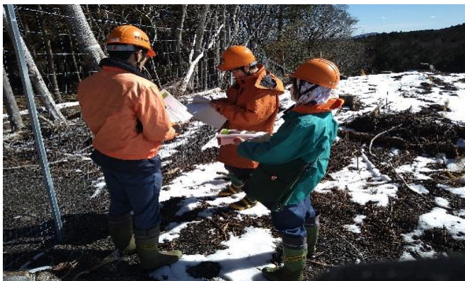
造林事業地の見学

2日目は、捕殺されるシカを見学し葛藤を覚えた様子ですが、有害生物の捕獲の必要性について理解したようです。造林事業