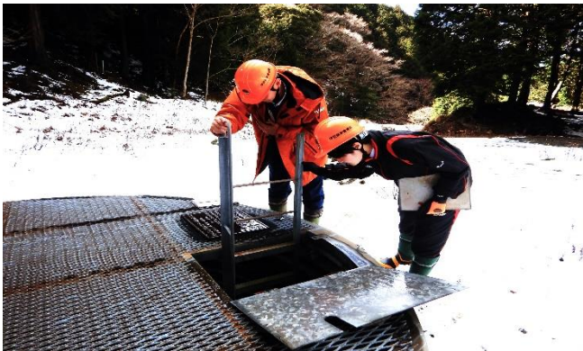
地すべり防止工事（集水井）の見学

このようなことから、シカの有害捕獲事業を行っている当署の職場体験プログラムを希望したとのことでした。