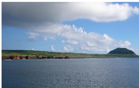
摺鉢山と千鳥ヶ浜

渡航することが難しい硫黄島ではありますが、 少ない機会を有効に使って島の状況を把握し、 関係機関と協力して国有林野の適正利用と 管理に努めます。