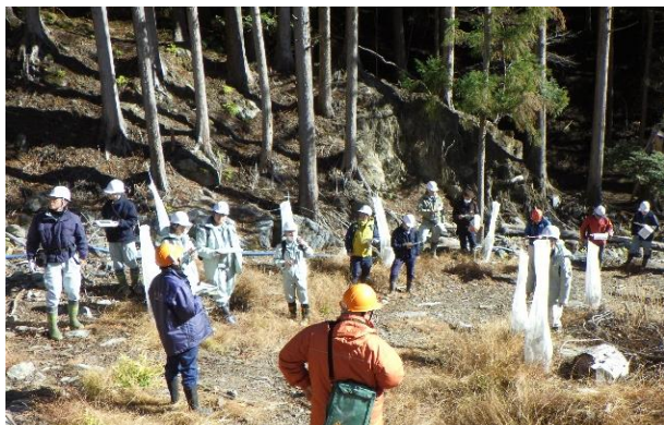
単木保護ネットの状況説明