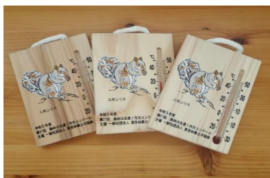
参加賞の木製温度