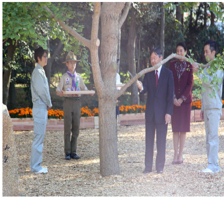
皇太子殿下によるお手入れ

全国各地から緑化関係者等の参加を得て、皇太子同妃両殿下によるお手入れ行事（平成8年全国植樹祭で天皇皇后両陛下がお手植えされ成長した樹木の枝打ち）や式典行事、参加者による育樹活動等を通じ、森林を育て次世代へ引き継ぐことの大切