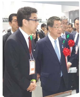
吉川農林水産大臣(右)へ説明する齋藤局長(左)

ひのきの香りを体験してほしいと職員が手作りした木の香り袋配布では、「いい香り」「何処で売ってるの?」「お風呂に入れても大丈夫?」など多数質問を受けました。用意した約250個が約20分でなくなる大人気でした。