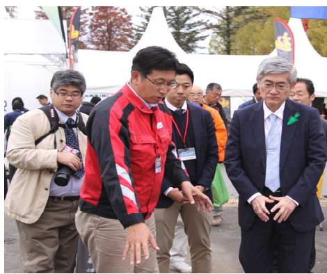
森林・林業・環境機械展示実演会で説明を受ける牧元林野庁長官(右)