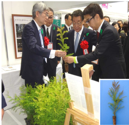
吉川農林水産大臣(中央)へコンテナ苗の説明

コンテナ苗展示では、林業関係者でも初めて見る方が多く、触ってみたりして職員の説明を熱心に聞いていました。用意していたパンフレット類もすぐなくなる程の人気でした。午前中には、式典前に吉川農林水産大臣や牧元林野庁長官も立ち寄り、木の輪切りへの絵書き体験や展示パネル等をご覧になり、特にコンテナ苗の前では吉川大臣は熱心なご質問をされていました。