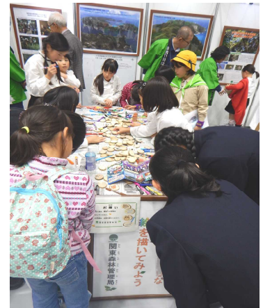
木の輪切りへの絵描き体験

木の漢字クイズでは、大人から子供までパネルの前で立ち止まり、頭を傾けながら読めた漢字を指を折って数えている様子が印象的でした。多めに準備していた配布用の解答用紙も午前にはなくなるほどの人気でした。