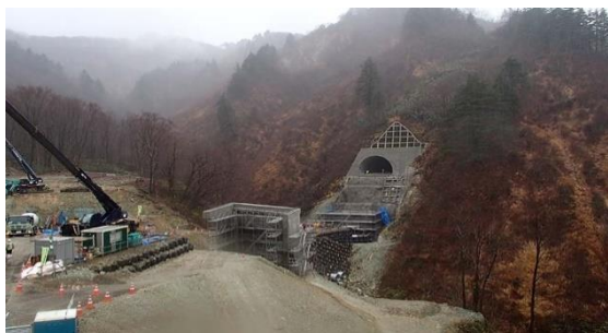
現在工事中の国道289号線

管内の特色としては、福島県只見町と新潟県三条市を結ぶ国道289号線（通称「八十里越」）があり、明治時代までは物資輸送の重要な道でした。大正時代に入ると物流は鉄道へと移行し、徐々に廃れていくこととなりました。終戦後、太平洋と日本海を結ぶ路線の建設が叫ばれるようになり、この峠道も見直され、国道へ昇格し昭和61年から新設・改良工事が始まりました。