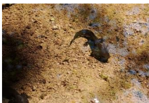
オオサンショウウオ