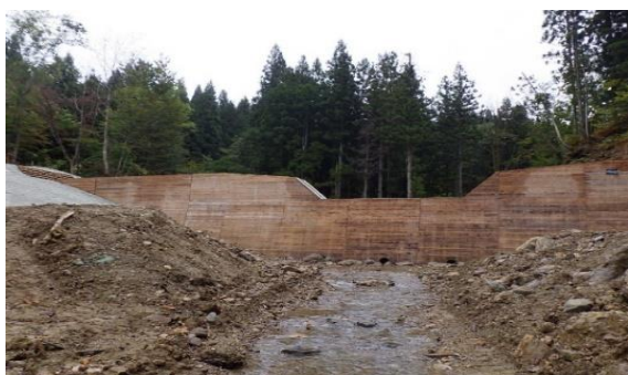
令和3年度完成のコンクリート谷止工(西ノ沢)

森林官としての経験は長いですが、今年度は事務所の改築が予定されており、新しい事務所で初心に返りがんばりたいと思います。