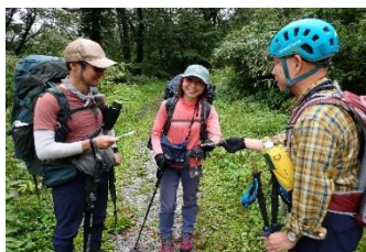
入山者との ふれあい