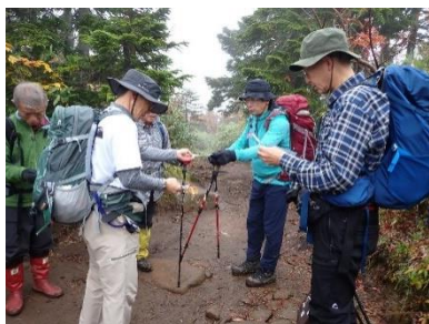
手作りのし おりを配布