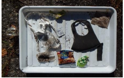
今日のゴミはこんな感じです

また、小笠原諸島においては、ほとんどの国有林が森林生態系保護地域や世界自然遺産に指定されています。特異的・原生的な自然を後世にわたり健全な状態で保全・管理するため、違法伐採や固有植物の盗採等の防止、マナーの向上等と呼び掛けるとともに、入林者数を計測するカウンターを設置し森林の利用状況の把握を行っています。