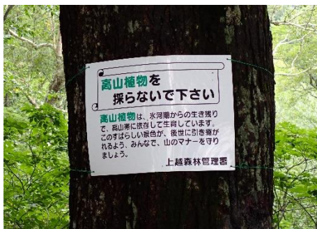
植生保護の注意喚起表示