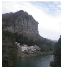
八木ヶ鼻と五十嵐川

元々は村松営林署の管轄だったため、下越森林管理署が管轄する時代がありました。当事務所の位置はちょうど、中越署と下越署の中間地点に位置しており、私は新発田市（下越署管内）から通勤しています。