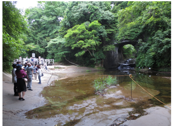
多くの観光客が訪れる亀岩の洞窟