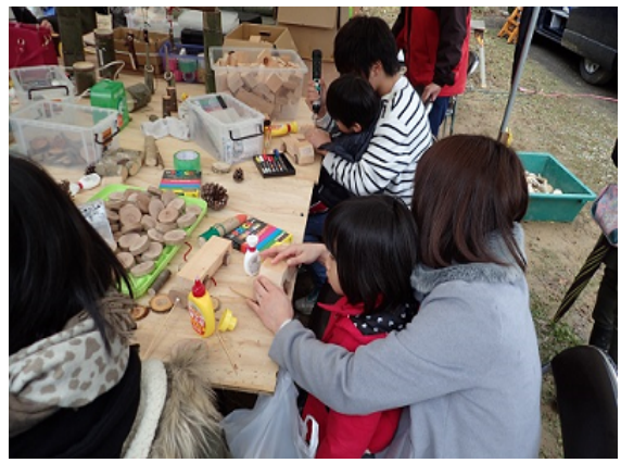
地元イベントでの木工クラフトブース