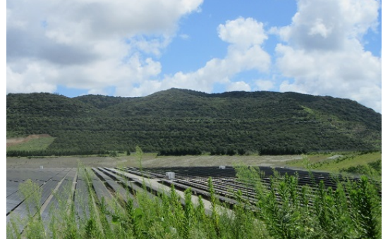
緑化復元された鬼泊山国有林 (平成29年6月現在)