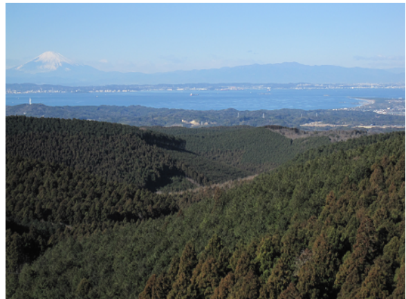
かのうざん 鹿野山から望む東京湾と富士山

国営公園や県立自然公園等に指定された風光明媚な箇所も多く、首都圏はじめ各地から多くの観光客が訪れます。また、国有林の9割は水源かん養保安林として地域の水瓶となっており、保安林機能の高度発揮と風致等に配慮した管理経営に努めています。