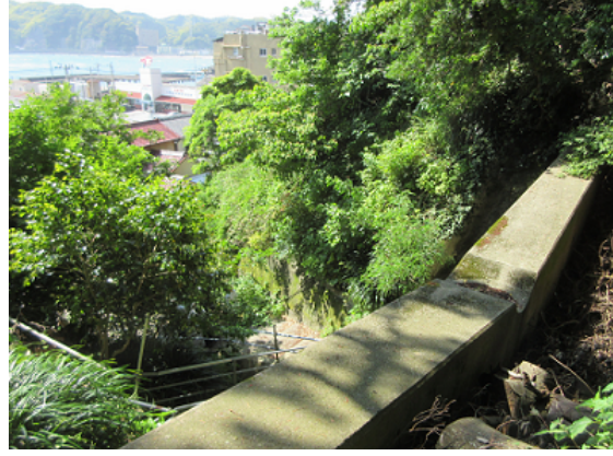
国有林治山施設と保全対象（集落・旅館等）

また、昨年、君津市内に突如として観光地が生まれました。「亀岩の洞窟」といい（濃溝の滝とも呼ばれています）、千葉県上総地方で多く見られる江戸時代に造られた農業用の川廻し（蛇行した河川を人工的に短絡させる工法）のための隧道です。洞窟の中に差し込む日の光が岩肌と川面を照らす様子が幻想的だとして、その写真がSNSで拡散されたことをきっかけにTVでも紹介され、多くの観光客が訪れています。