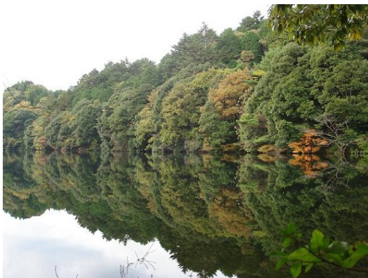
筒森自然観察教育林内にある勝浦ダム