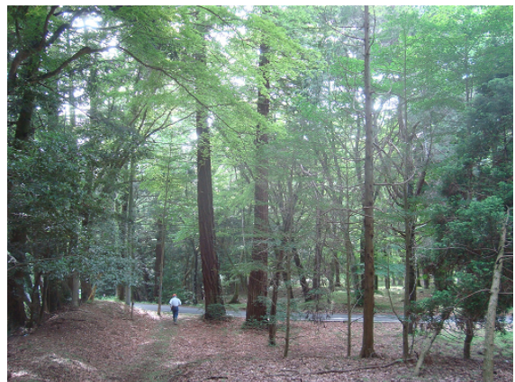
大正から昭和初期に造成された樹木見本林

樹木見本林は、林野庁職員の研修用に大正14年から昭和3年にかけて植栽・造成されたもので、国内外60科・269種の樹木が展示されています。また、筒森自然観察教育林内の溪流があるエリアは、深山の溪谷の趣きがあり、親水広場として親しまれ、TVや映画の撮影地としてもたびたび使われています。