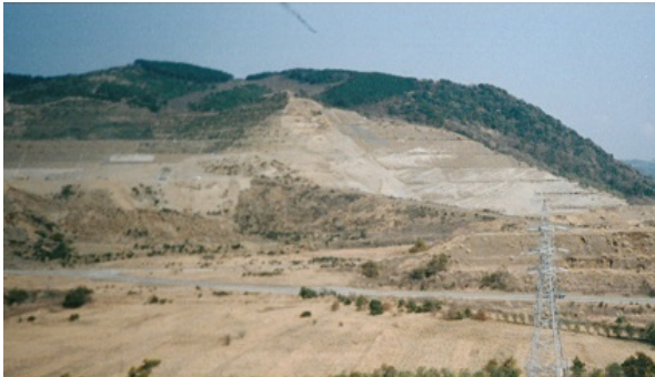
山砂採取中の鬼泊山国有林 (平成13年当時)

その後も、大型公共プロジェクトの建設資材として必要な分について、山砂採取業者に販売を行っており、近年では、平成8年から14年にかけて東京湾横断道路建設のために山砂採取が行われました。採取跡地は、国有林の緑化技術によって緑化復元され、現在に至っています。