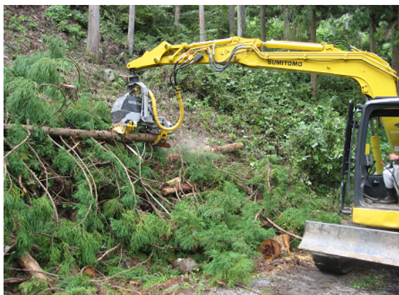
高性能林業機械を使用した森林整備

採し、3列を残すというように、列状に伐採する「列状間伐」を実施しています。また、生産された木材は、国産材の需要拡大や加工・流通の合理化等に取り組む木材業者等と協定を締結し、木材を安定的に供給する「システム販売」を推進しています。