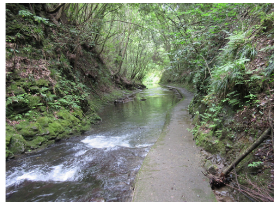
深山の溪谷の趣きがある親水広場 しんすい