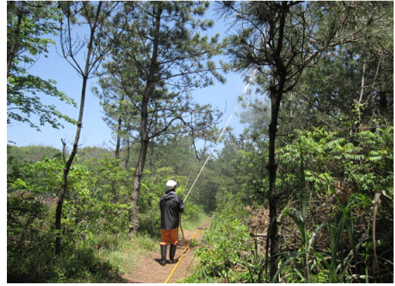
地上からの薬剤散布状況

また、この君ヶ浜海岸林付近は、観光客による空き缶等のポイ捨てや、近年は、粗大ゴミの不法投棄も散見されています。このため、例年5月に銚子市が行う「銚子ゴミゼロ運動」に当所も参加しており、君ヶ浜海岸の国有林の美化活動を行うなど地元と連携して景観維持に取り組んでいます。