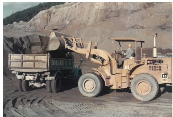
きなだやま 鬼泪山製品事業所による山砂直営生産の様子 (不動谷国有林 昭和50年頃)