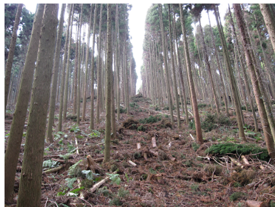
列状間伐された林内（戸崎国有林）

木材生産の拠点となっている一方で、原生的な森林生態系からなる自然環境の維持や遺伝資源の保存等を目的とする「保護林」に設定された森林もあります。