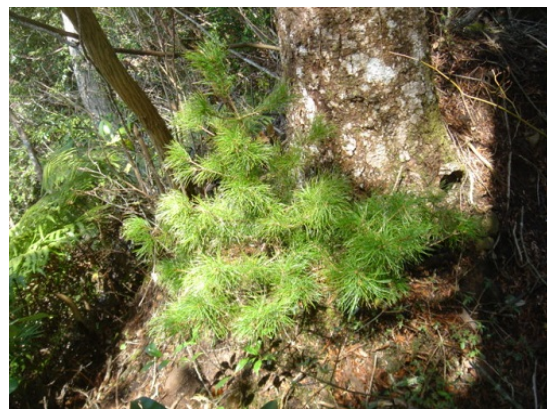
古木の根元から育ったヒメコマツの稚樹