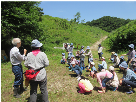
下草刈り体験作業に参加したガールスカウトの皆さん

地域の観光イベントにも参加しています。例年秋に開催される大多喜町の観光イベントでは、木工クラフト体験ブースを設置し、クラフト作りを通じて森林のもつ公益的機能をPRしています。この木工クラフト作りは好評で毎年参加していただいている方もいらっしゃいます。