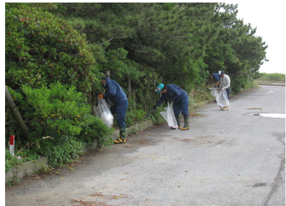
職員による清掃活動

また、この君ヶ浜海岸林付近は、観光客による空き缶等のポイ捨てや、近年は、粗大ゴミの不法投棄も散見されています。このため、例年5月に銚子市が行う「銚子ゴミゼロ運動」に当所も参加しており、君ヶ浜海岸の国有林の美化活動を行うなど地元と連携して景観維持に取り組んでいます。