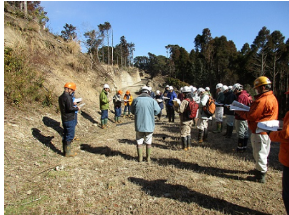
林業専用道の現地検討会