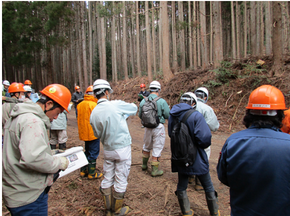
列状間伐の現地検討会

今後、高性能林業機械を利用して伐採から地拵え、植栽までの作業を連続して行う一貫作業システムによる施業に取り組む予定であり、こうした取組についても積極的に現地検討会等を開催し、普及を図っていきたいと考えています。