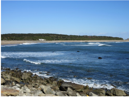
銚子市君ヶ浜海岸（君ヶ浜国有林）