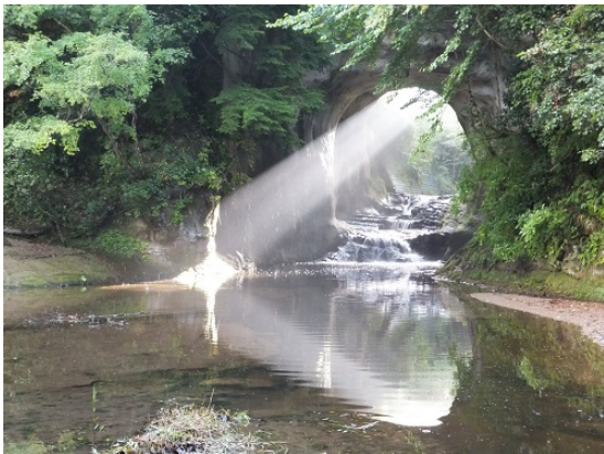
亀岩の洞窟 (洞窟からの光と川面を照らす様子がハート型に見えます)

また、昨年、君津市内に突如として観光地が生まれました。「亀岩の洞窟」といい（濃溝の滝とも呼ばれています）、千葉県上総地方で多く見られる江戸時代に造られた農業用の川廻し（蛇行した河川を人工的に短絡させる工法）のための隧道です。洞窟の中に差し込む日の光が岩肌と川面を照らす様子が幻想的だとして、その写真がSNSで拡散されたことをきっかけにTVでも紹介され、多くの観光客が訪れています。