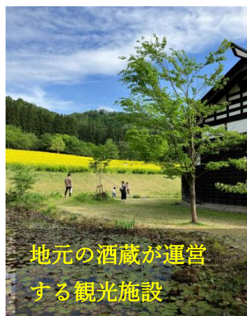
地元の酒蔵が運営する観光施設