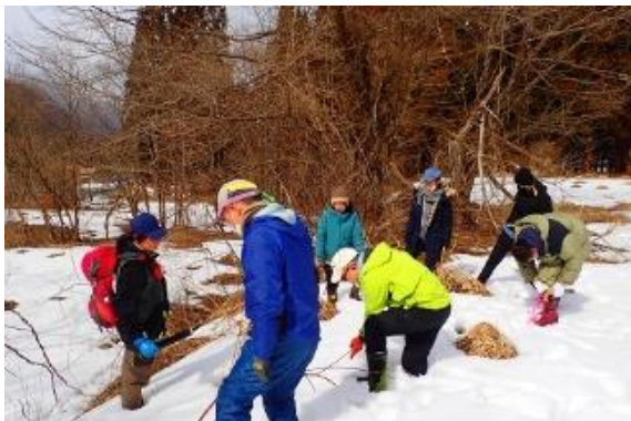
▲雪下から顔を出しているニセアカシアを除去

サポーターの中にも驚異の繁殖力を不安に感じる方もおり、あらためて駆除作業を継続していくことの重要性を皆で共有することができました。