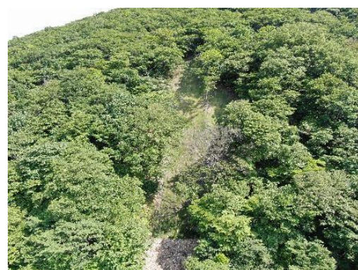
▲鍋割地区復旧治山工事

この工事では、崩れた山腹斜面に堆積していた土砂の流出と、崩壊の拡大を防ぐため、斜面にロープネット工を施工しました。工事の着手から完成までの進捗を可視化するため、「工事記録ダイジェスト」を作成し、各種打合せ、段階確認、完成検査をスムーズに行うことができたほか、資材運搬用モノレールの過積載防止について工夫を凝らすなど、優れた施工管理を行ったことなどが評価されました。