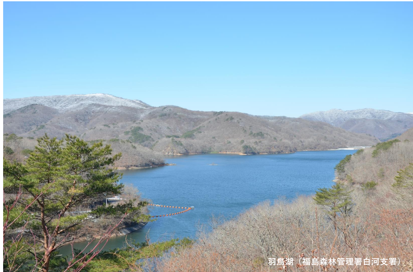
羽鳥湖（福島森林管理署白河支署）

前橋市岩神町4-16-25 TEL.027-210-1158 https://www.rinya.maff.go.jp/kanto/