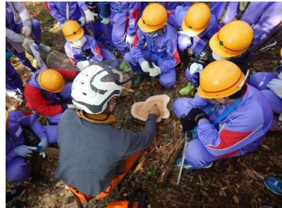
▲森林管理署等で行われている森林教室や林業体験