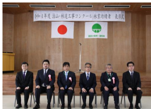
▲記念撮影（林業功績者）

今後も本コンクールの趣旨に則り、コスト縮減、新技術の提案、環境への配慮等、創意工夫を積極的に行い、よりよい工事の施工となるよう努めるとともに、災害の発生時には速やかな復旧・対策を実施してまいります。