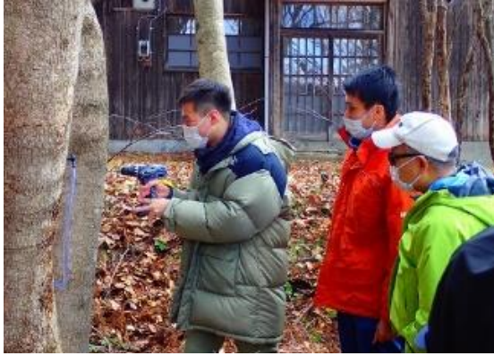
▲イタヤカエデの穴開け作業