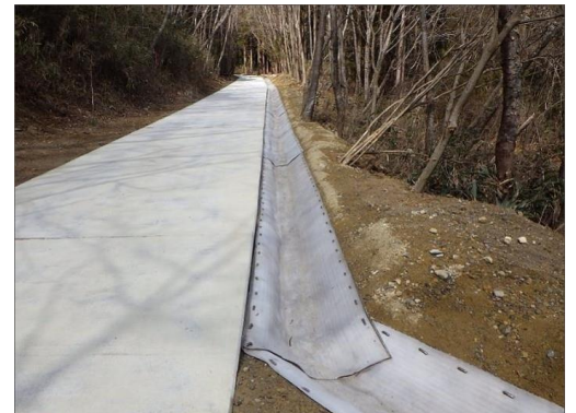
▲銅山林道外1改良工事（R2三次補正）

この工事では、施工箇所の地形の影響から雨水が集まりやすく、林道両側の土砂部分が洗掘され、コンクリート舗装にまで影響を与える危険性がありました。受注者からの提案により、水をかけるだけでコンクリート面が構築される特殊な布材を側溝部分に貼り付け、水路工を作設しました。シート状になっているため地形になじみやすく、散水のみで硬化するため施工性に優れ、施工後の維持管理も容易などのメリットのある工法を提案し、丁寧に施工した点が評価されました。