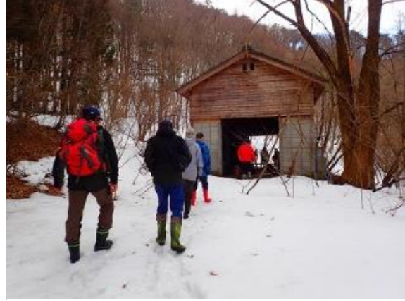
▲雪面を歩いてアトリエの見学