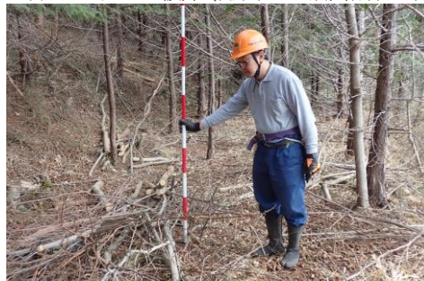
▲除伐作業の完了確認をする筆者（君津市・戸崎国有林）