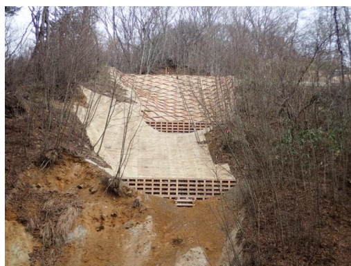
▲相倉地区復旧治山工事

この工事では、谷止工に木製残存型枠、山腹工に木製軽量法枠工と木製かご枠工を採用し、工事全体で木材を積極的に利用しています。また、隣接する町道沿いに一般の方でも利用できるトイレを設置し、目隠しフェンスに木材を使用することで、森林土木工事のイメージの向上と木材利用の推進を図り、美観に優れ、環境に配慮した工事を施工した点が評価されました。