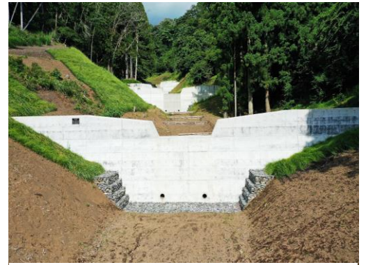
▲小山地区(奥の沢川1外)直轄治山工事(R2三次補正)

この工事では、複数の箇所では谷止工や山腹工、緑化工といった多岐にわたる工種を施工しました。受発注者間の情報共有の円滑化と事務負担の軽減を図るため、情報通信技術（ICT）を活用し、建設機械を効率的に使用し、計画的な工程と施工管理を行いました。また、「3Dスキャナ測量」を採用し、現場状況を立体的に捉え、完成シミュレーションによる事前の課題把握や、関係者間で情報を共有し施工に反映させたことが評価されました。