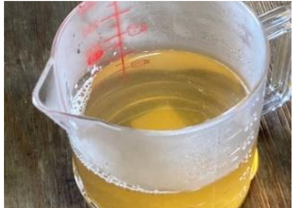
▲メープルシロップが完成！濃厚で甘さも抜群！

赤谷センターでは、大地や自然が織りなす様々な自然とのふれあいや、森林内での貴重な体験を得られる場を提供し、子供から大人まで幅広い年齢層の皆様に親しんでいただける取組を今後も企画してまいります。