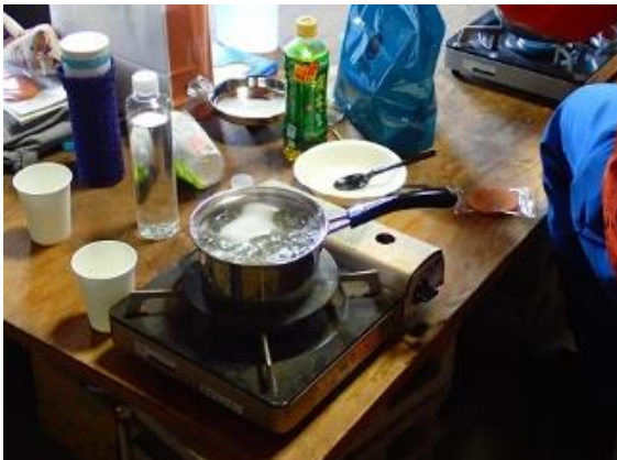
▲採取してきた樹液を煮詰めていくと…

お土産として持ち帰ったサポーターからは、ご家族に大好評だったとのメールも頂戴しています。雪解け時期における新たな赤谷の魅力を多くの皆さんに提供できました。