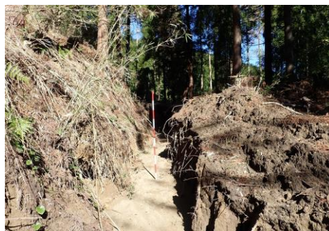
▲大雨後の作業道洗掘（君津市・戸崎国有林）

台風の大型化は地球温暖化も原因の一つと言われていますので、しっかりとした森創りによって、少しでも地球温暖化防止に貢献できればと取り組んでいます。