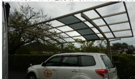
▲台風15号により飛ばされたカーポートの屋根（富津市・湊森林事務所）