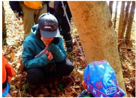
▲樹液をちょっと味見…「ほんのり甘いね」

十分な量を採取したら、後はひたすら煮詰める作業です。甘さ十分なシロップにするためには、1/40 程度の量まで煮詰める必要があります。この日採取した樹液では少しの量しかできないため、事前に職員が同じ樹から採取しておいた樹液も使用しました。サポーターの皆さんがニセアカシアの駆除作業に汗を流すなか、職員が焦げないように注意しながら加熱・煮詰めること約4時間、黄金色のメープルシロップを完成させました。当初は無色透明だった樹液が、普段目にするメープルシロップと同じ色合いになり、味についても、売り物に負けず劣らずのしっかりとした甘みを含んだものとなりました。予想以上の出来映えに皆さん大喜びでした。