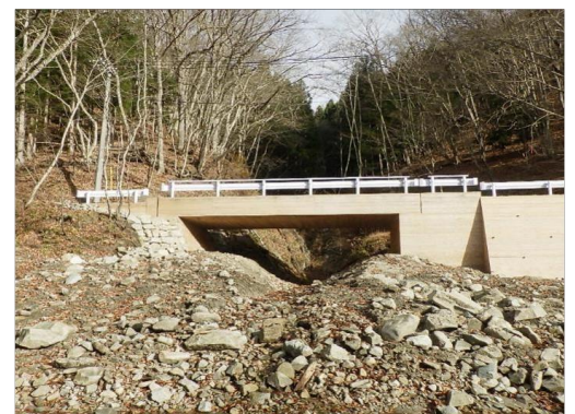
▲入山林道改良工事（R2ゼロ国）

この工事は、台風により流失した橋の架け替えです。下流に養魚場があることから濁水を流下させないため、台風の際に発生した流木の撤去、土砂を流入させないため河床に堆積している土砂を大型土の中詰をして利用し仮設道路を作設するなどの工夫を行いました。また、橋梁工の型枠には平割材を採用し、通常、コンクリートの漏れ出し防止のために必要となる資材を省略できるよう工夫しています。現地発生材を使用した石積間詰と併せ、周辺景観になじむよう配慮されている点が評価されました。