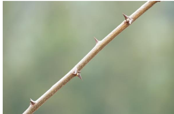
▲トゲが多いため、作業するのも一苦労です