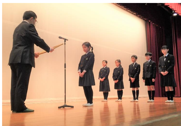
▲江坂所長から表彰状の授与

今年も新型コロナウイルス感染症対策のため、表彰式を行うことができませんでした。このため、最優秀賞（林野庁長官賞）などを受賞した6人の児童が在籍している相模女子大学小学部には、江坂東京事務所長が訪れ、直接、受賞者へ賞状と副賞を授与しました。また、その他の受賞者へは、学校へ賞状