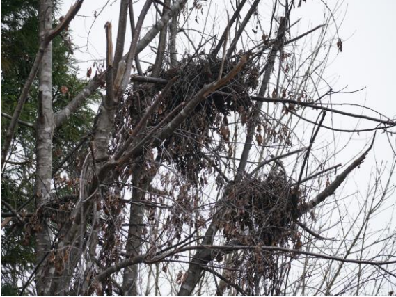
▲サクラの樹上に出来たクマ棚を観察

今回初めて参加されたサポーターがいたため、初回説明を兼ねて「いきもの村」を案内しました。赤谷プロジェクトの成り立ちや、活動拠点としている「いきもの村」について説明した後、旧苗畑敷地内の散策路を歩きました。残雪のため植物などを観察することはできませんでしたが、クマが木登りした際にできたクマ棚の跡や、新しいカモシカのふん、雪面に残るシカの足跡など、フィールドサインと呼ばれる動物たちが残した痕跡を見て楽しみました。また、桐の植栽地の野ウサギ食害防止用のネット巻きや、土場に集積されたスギやヒノキの丸太、森林環境教育の場としているアトリエなど、林業技術の知識にも触れ、多くの皆さんが興味を示してくれました。