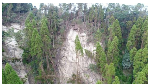
▲台風15号による被害（君津市・三川谷国有林78林班）