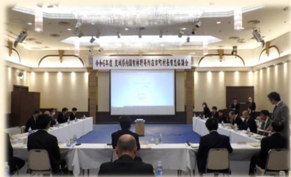
協議会の様子（茨城県内協議会）

協議会では、地域社会と国有林野事業の連帯の強化を図り、地元農山村の社会経済の発展と国有林野事業の円滑な遂行に寄与することを目的として、市町村長等との意見交換を実施しています。