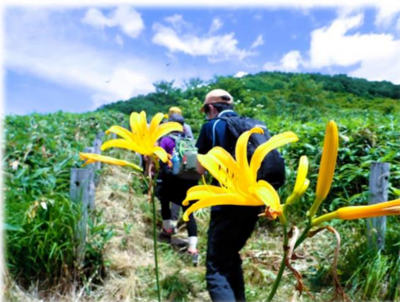
ニッコウキスゲの咲くお花畑

快晴の青空の下、新潟県側の旧三国街道から三国山山頂(1636m)まで、ニッコウキスゲの咲くお花畑など標高約1500mの夏山を散策しました。