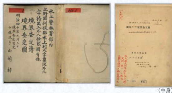
境界査定簿（明治時代）

この調査により所有者が明らかにならなかった奥地の森林・原野は官林に帰属することとなり、内務省（後に山林局）の所管となりました。その後、北海道の官林については内務省所管の北海道国有林として分離独立し、また、官林から選ばれた美林については、皇室の「私有財産」としての御料林に組み入れられました。