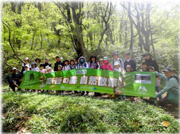
ニリンソウの群落前で記念撮影

ブナやミズナラの新緑、ニリンソウの群落など春の息吹を体感しながら彩り豊かな旧三国街道を散策しました。