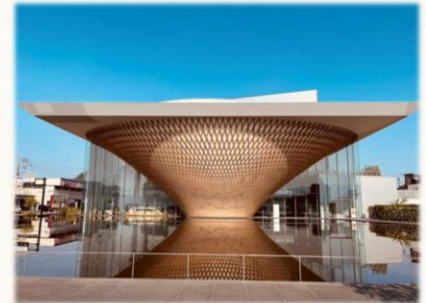
富士ヒノキを使用した静岡県富士山世界遺産センター

管轄する国有林の課題としては、ニホンジカによる森林への被害が深刻化していることがあげられます。静岡県におけるニホンジカ生息密度調査では、富士山西部地域で 30 頭/km 2 以上（自然植生にあまり目立った影響が出ない密度は「3～5 頭/km 2 」）と生息頭数が非常に多くなっており、防護柵の設置が欠かせなくなっています。このため、ニホンジカの低密度化に向けて、署による有害鳥獣捕獲委託事業、県による管理捕獲、職員自らが実施する「くくりわな」捕獲などにより、適正な個体数管理となるよう引き続き取り組んでいきたいと考えています。