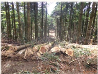
列状間伐（ウラジロモミ）

現在、当事務所管内においては、ヒノキやウラジロモミを中心に素材生産事業や立木販売も行っています。富士山麓周辺の厳しい環境下で育ったヒノキは木目が細かく、強度や耐久性に優れていることから地域のブランド材「富士ヒノキ」として注目されており、国有林材の安定的な供給が期待されています。