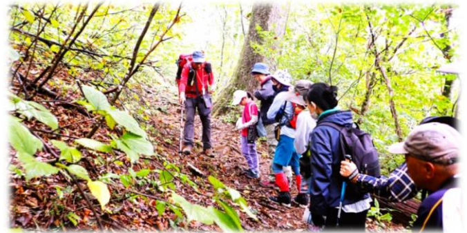
キノコの解説をしているガイドさん

小雨の中、紅葉が始まった旧街道をブナやミズナラの樹々を観察しながら散策しました。