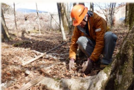
「くくりわな」を設置する筆者