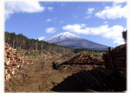
分収育林皆伐箇所と富士山