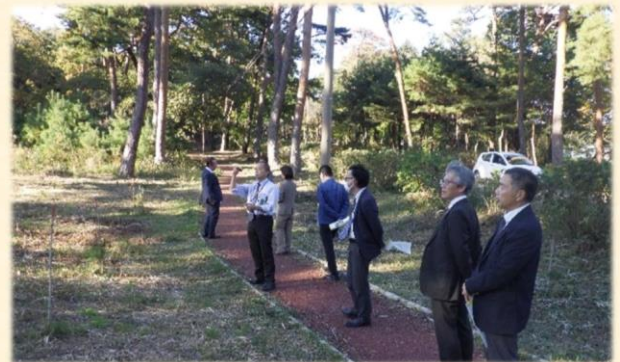
那須街道アカマツ林 植栽箇所（栃木県那須町）