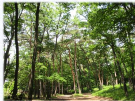
現在の「那須街道アカマツ林」

現在は「那須街道アカマツ遺伝資源保護林」として管理されていますが、松くい虫の被害が広がってきていることから、塩那森林管理署と地元のボランティアがアカマツ林を守る活動を行っています。