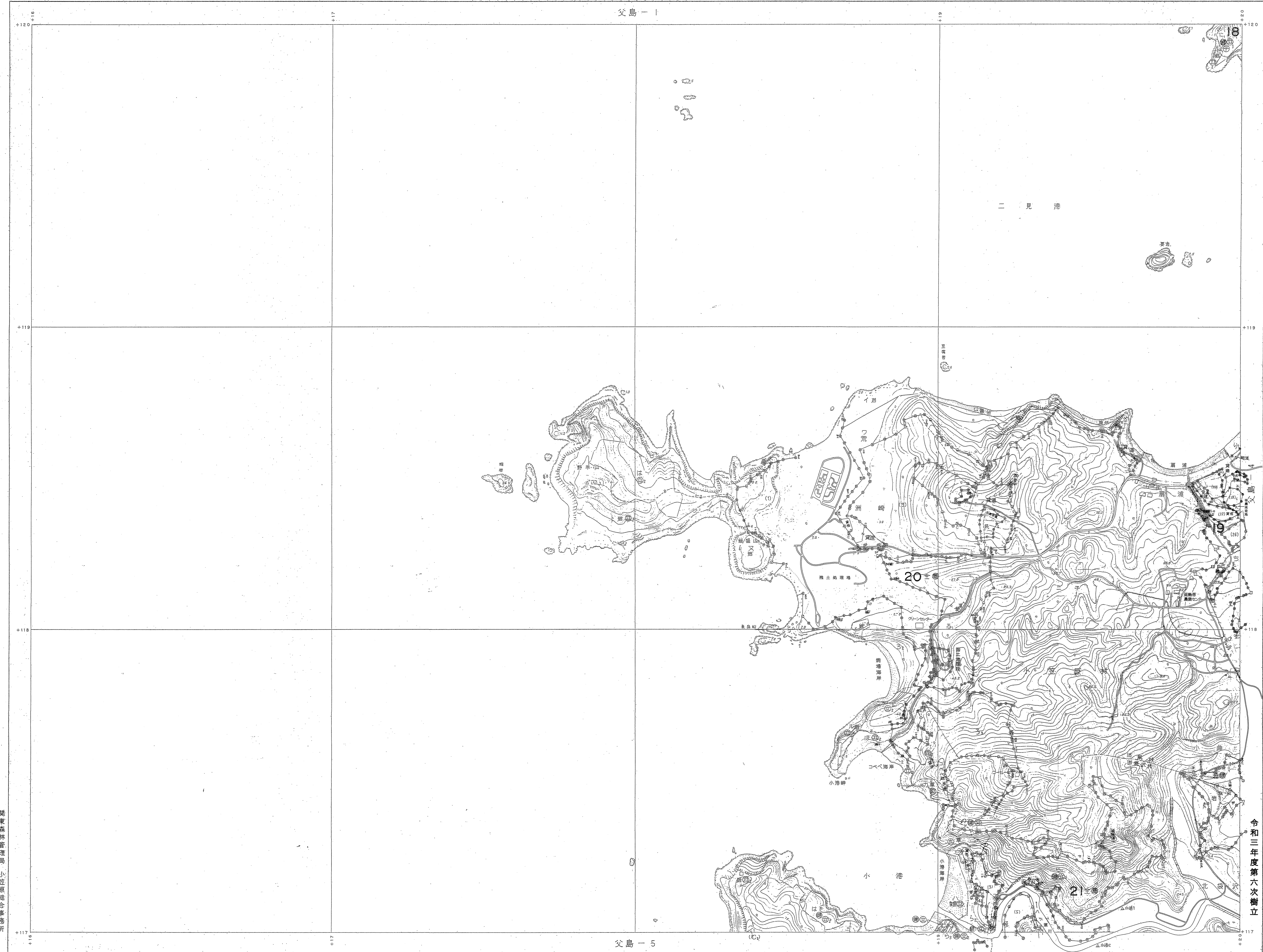
XIV-GE 04 父島-3