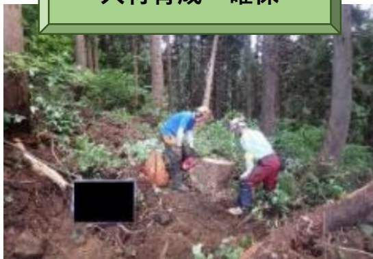
新規雇用に係る林業事業者への支援及び新規就労者への支援 （新潟県柏崎市の事例）