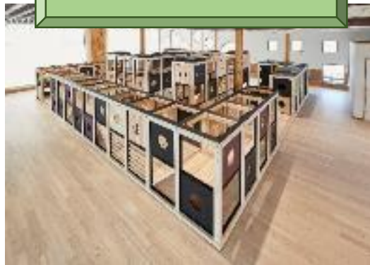
「道の駅ふくしま」に県産材を活用した木製遊具を設置 （福島県福島市の事例）