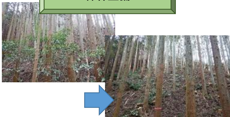
森林整備（間伐）の実施 （福島県いわき市の事例）