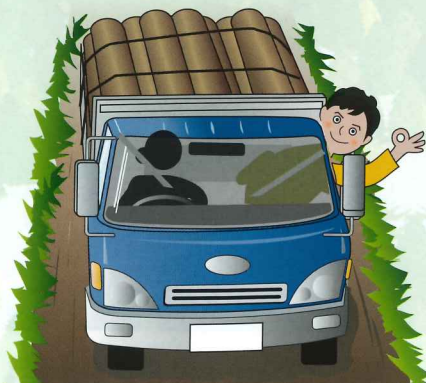
平成30年度林道交通事故発生原因別件数 (国有林林道等発生件数 10件)