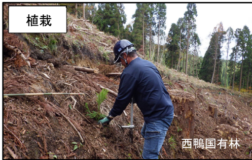
隣接の天神川森林計画区にて