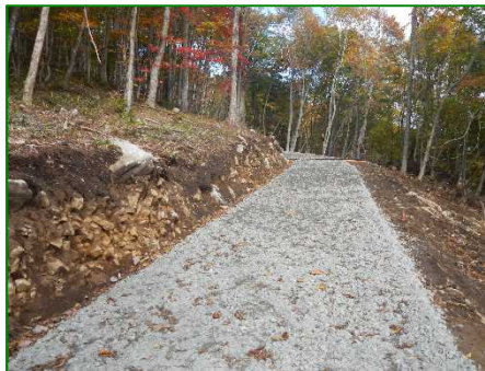
林道（林業専用道）新設