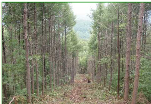
遠島山国有林（保育間伐）