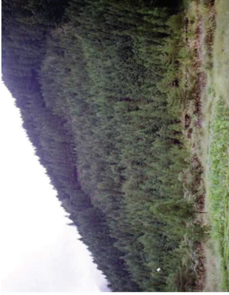
保全対象：川井集落