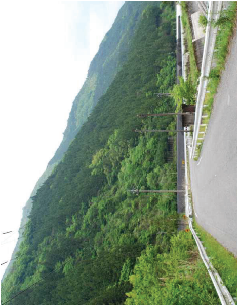
これまでの復旧状況