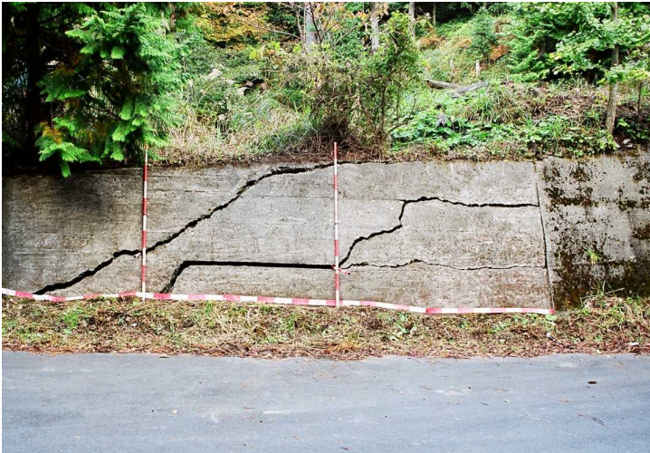
被災状況：国道擁壁のクラック