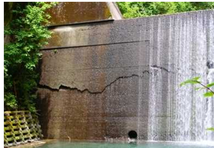
被災状況：谷止工のクラック