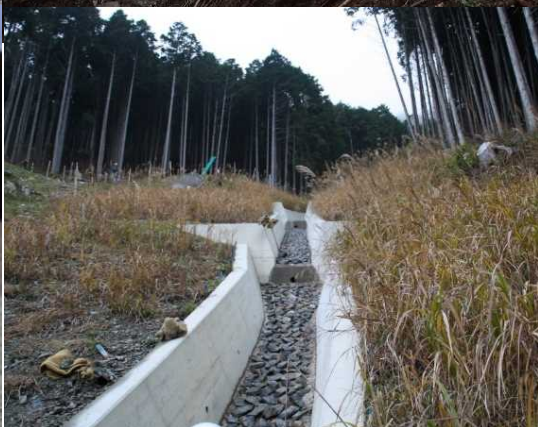
保全対象：下流集落（落合地区）