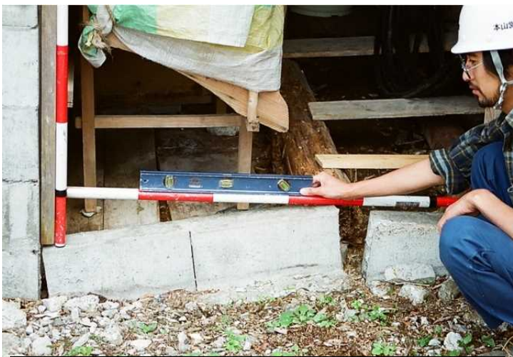
被災状況：民家基礎のクラック