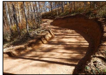
路網整備事業（新設工事）