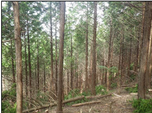
中信森林管理署 間伐