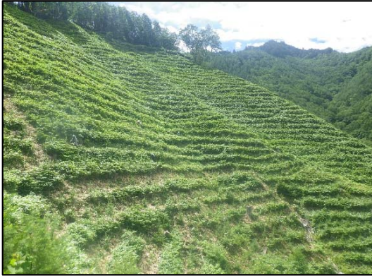
中信森林管理署 下刈