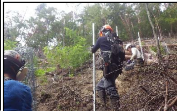
シカ防護柵設置作業