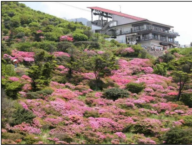
普賢岳生物群集保護林(ミヤマキリシマ)