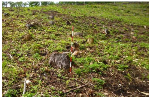
大澤山国有林 (植付)