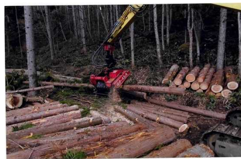
鬼原国有林 (保育間伐)