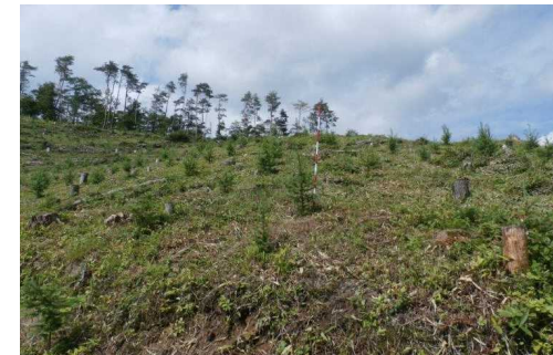
東恩徳国有林 (下刈)