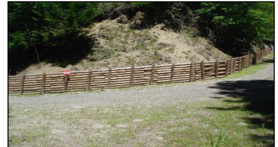
平成29年度 南信森林管理署 星ヶ塔林道改良工事