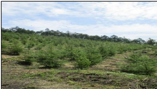
平成29年度 南信森林管理署 下刈