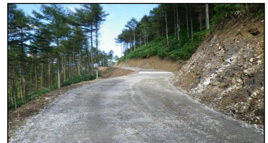
平成29年度 南信森林管理署 兀嶽林業専用道新設工事