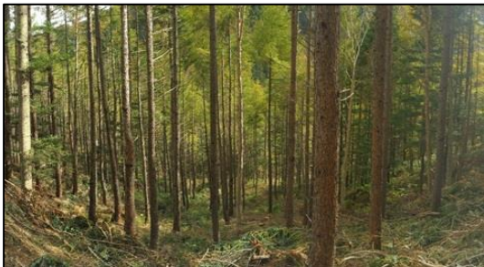
平成29年度 南信森林管理署 保育間伐