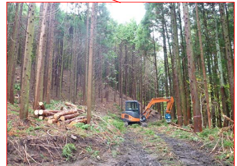
森林整備事業(保育間伐)