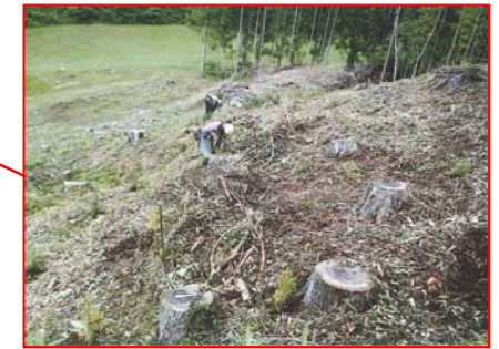
森林整備事業(地拵・植付)