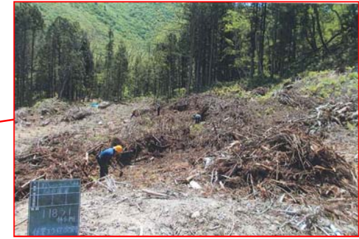
森林整備事業(地拵・植付)