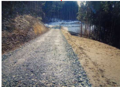
君田(小川)作業道 (平成20年度新設)