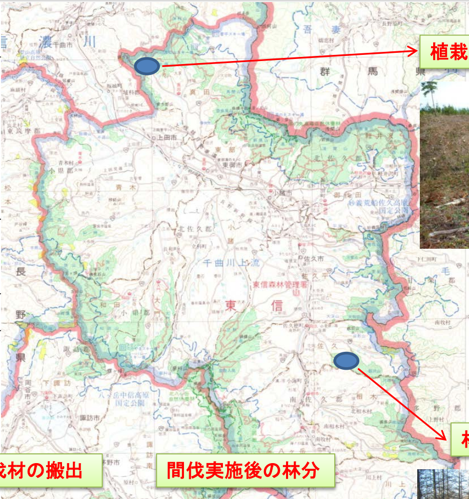
植栽(コンテナ苗の活用)