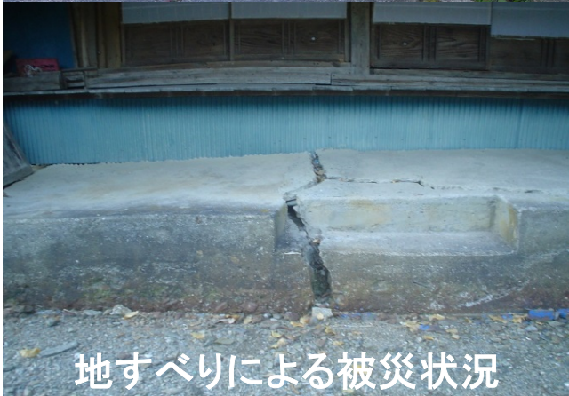
地すべりによる被災状況