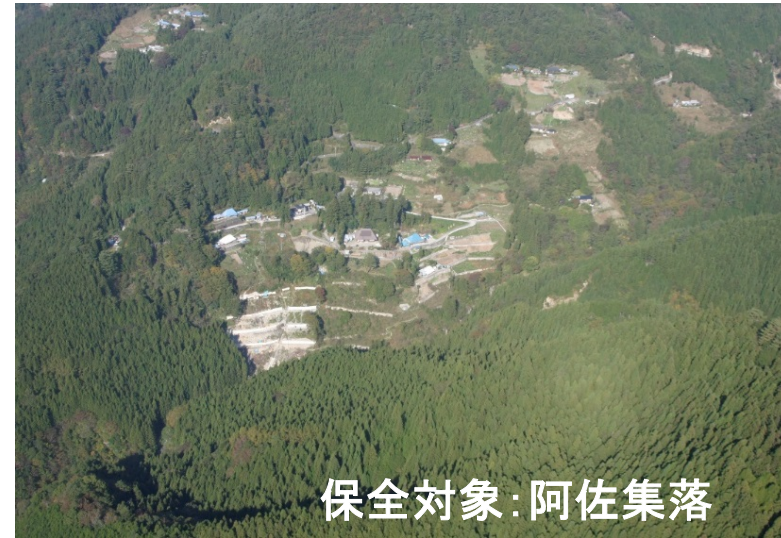
保全対象：阿佐集落