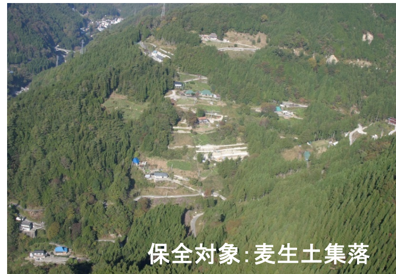
保全対象：麦生土集落