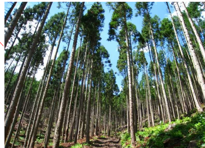
間伐（古殿町三株国有林）