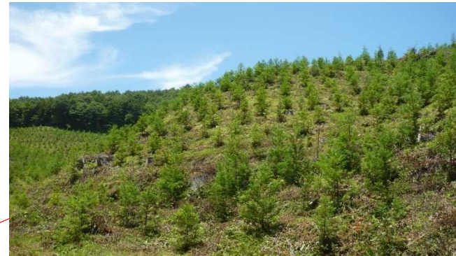
下刈（古殿町三株国有林）