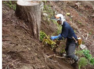
地拵・植付（古殿町三株国有林）