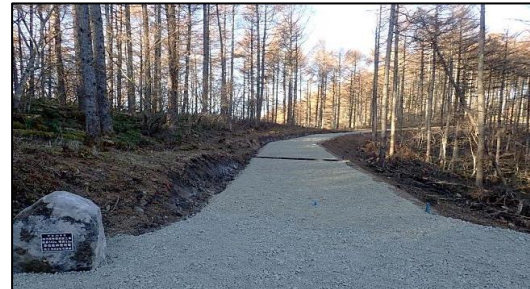
東信森林管理署 四方原林道新設工事