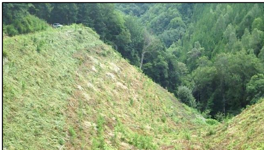
東信森林管理署 下刈