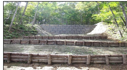
東信森林管理署 大門西林道改良工事