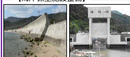
津波、高潮による被害を未然に防ぐため海岸堤防の整備を推進 津波・高潮対策としての水門整備