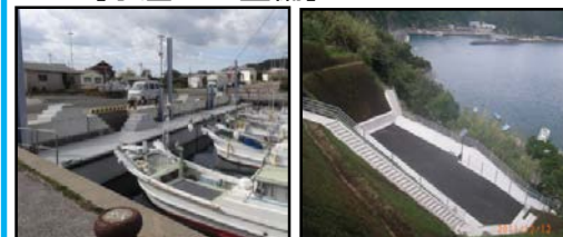
漁業作業の効率化と安全対策のための漁港整備 (岸壁改良) 漁村における津波避難対策 (避難地、避難路の整備)