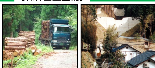
林道等の整備により効率的な間伐材等の搬出を実現 治山施設による山地災害の未然防止