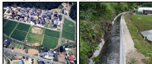
ほ場整備による農業生産性の向上と秩序ある土地利用の推進 老朽化した用水路の整備・更新