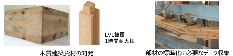
木質建築資材の開発

SCM推進フォーラム（協議会）の設置・運営による 川上から川下までのマッチング や、 木材需給情報を収集・分析し発信する取組等 を支援します。あわせて、中高層建築物における木材の利用環境整備、製材品等の流通実態の調査を実施します。また、木材加工設備等導入の利子助成・リース、森林認証材の普及啓発等の取組を支援します。