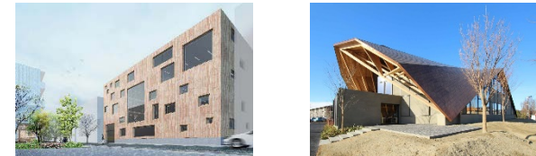
CLTを活用した街作りの実証

CLTを用いた先駆的な建築物の設計・建築や 街づくり等の実証 、CLT・LVL等の利用促進や 設計の容易化 、設計者・施工者の育成等を支援します。 木質建築資材の標準化や低コスト化等を支援 するとともに、 品質を保証するための仕組みの開発等 を実施します。