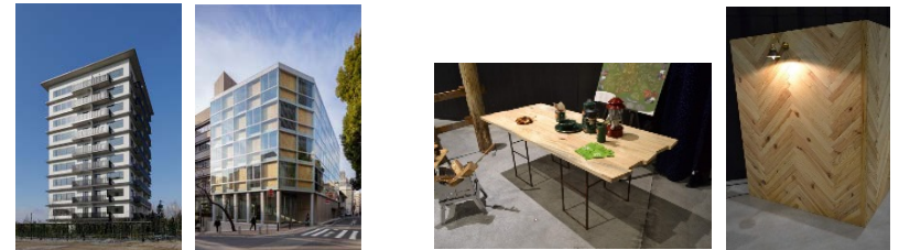
都市の木造化に向けた取組

都市部における 木質建築資材（JAS構造材、木質耐火部材、内装材等）の利用実証 、 山元還元を促進する優先枠（SCM推進フォーラム等） を設けて支援します。 大径原木や 羽柄材・内装材等の利用拡大等に向けた取組 を支援します。 また、川上から川下までの事業者が連携した顔の見える木材を使用した構造材、家具・建具等の普及啓発等の取組を支援します。