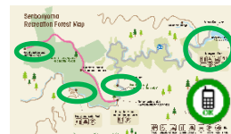
通話可能エリアマップの整備