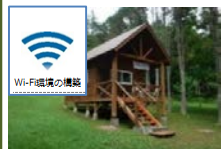
ワーケーション環境の整備 (Wi-Fi整備)