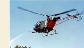
薬剤のヘリ空中散布