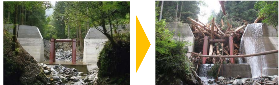
流木捕捉式治山ガムの整備