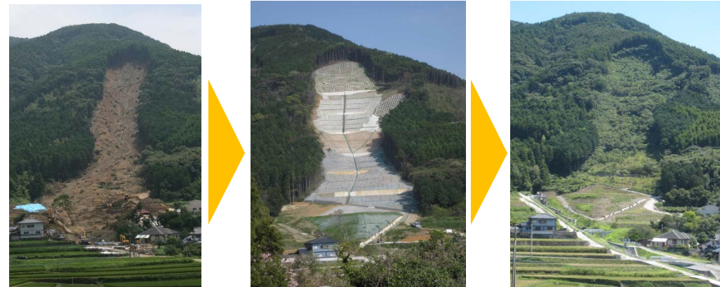
治山施設の整備等を通じた森林の防災・保水機能の発揮