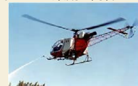
薬剤のヘリ空中散布

・ 薬剤散布（地上・空中散布）はマツノザイセンチュウを媒介するマツノマダラカミキリ成虫を直接殺虫するとともに、薬剤が染込んだマツの枝をかじった成虫も殺虫します。 ・ マツ樹体内に侵入するマツノザイセンチュウが増殖できないように薬剤を樹幹に注入します。