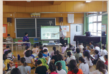
地元小学校での授業