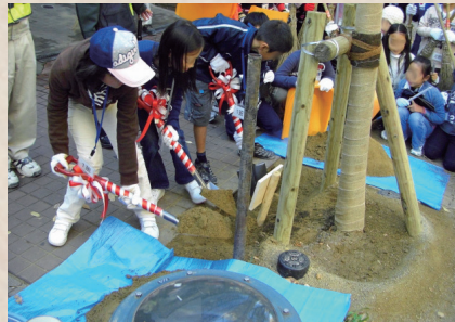
地元小学生参加の植樹祭