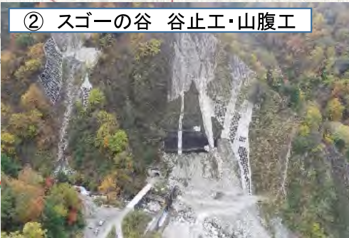
② スゴーの谷 谷止工・山腹工