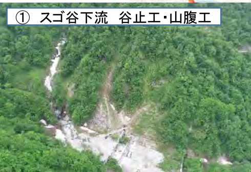
① スゴ谷下流 谷止工・山腹工