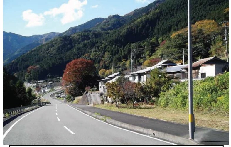
保全対象：谷口集落