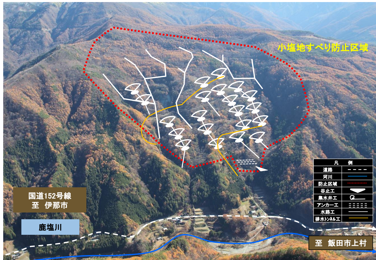
小塩地すべり防止区域 全景