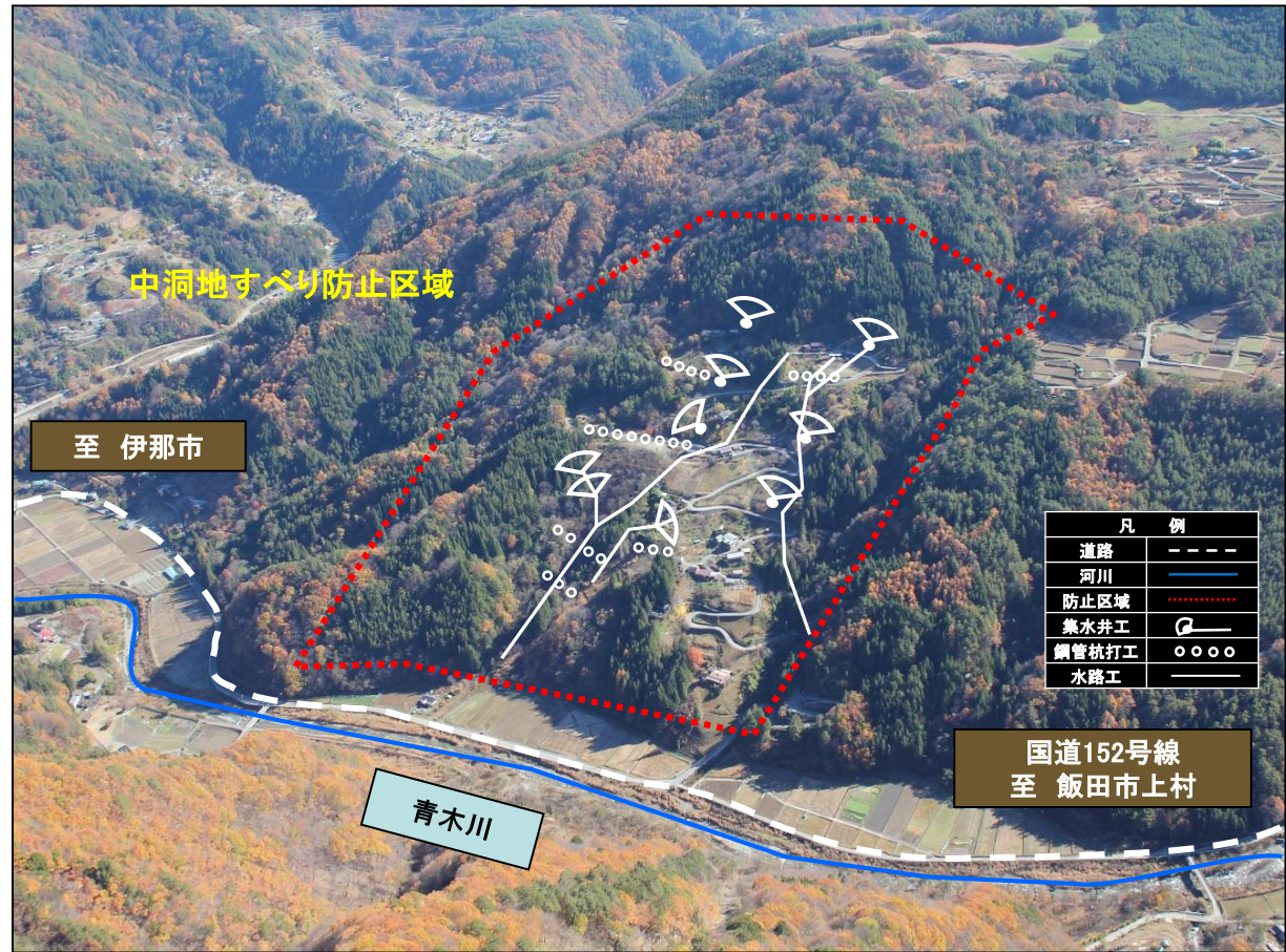
中洞地すべり防止区域 全景