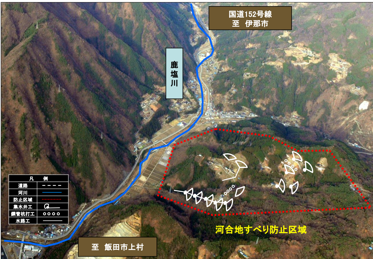
河合地すべり防止区域 全景